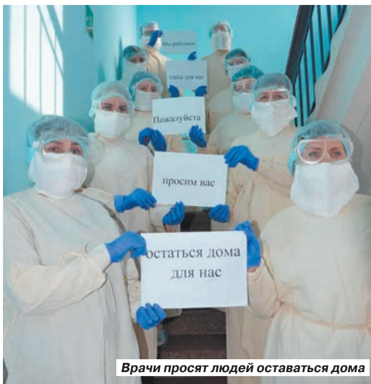
Врачи просят людей оставаться дома