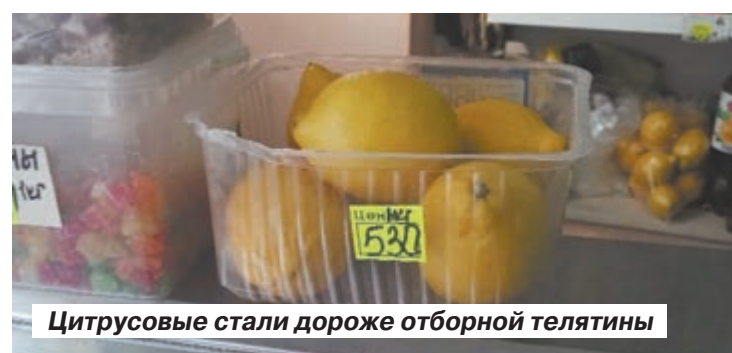
Цитрусовые стали дороже отборной телятины

Ужасаются саратовцы новым ценникам на имбирь, лимоны и чеснок. Многочисленные посты в соцсетях и сомнительные рассылки в мессенджерах о чудодейственных свойствах этих продуктов при коронавирусной инфекции сбили людей с толку. Многие бросились скупать «лекарства». По-видимому, на этом ажиотаже и решили заработать магазины.