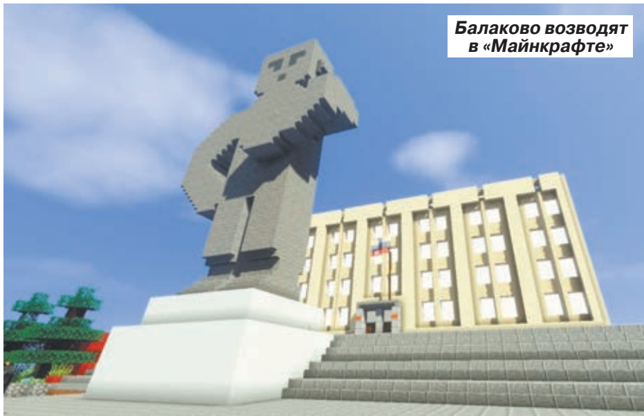
Балаково возводят в «Майнкрафте»

ПО ГОРИЗОНТАЛИ: ОСТАНКИНО – АМО – ЗАСТУП – «ИНТЕРНАЦИОНАЛ» – ВО – АУСМА – АРБАТОВ – «...ЛИ» – ВИТОК – БАСТАРД – АСА – ОР – КАКО – ЕР – ДАНЬ – ИЛ – ...ТРУА – ШМАТ – СПЕНДИАРОВ – ТРУБКА – ПРОВАНС – СИНИСАЛО – ТЕСЛО – КУК – САРТАК – ОМ. ПО ВЕРТИКАЛИ: ТАМБУР – ТУРНИК – НЕСЕССЕР – «НУ, ...» – РУ – БРИК – «КАЛЕВАЛА» – АСК – РО – ИРОД – ПАЛАС – СТОУН – ДРАЖЕ – ЛА – АГА – НАПОР – АБЗАЦ – РВАНЬ – ИРБИС – ШИРОТА – КУСТО – АТАКАМА – ВЕК – НАТО – АРРАС – «НАУКА...» – ОК – КИТО – НЛО – ЛЕВ – ТОЛ – СОМ.