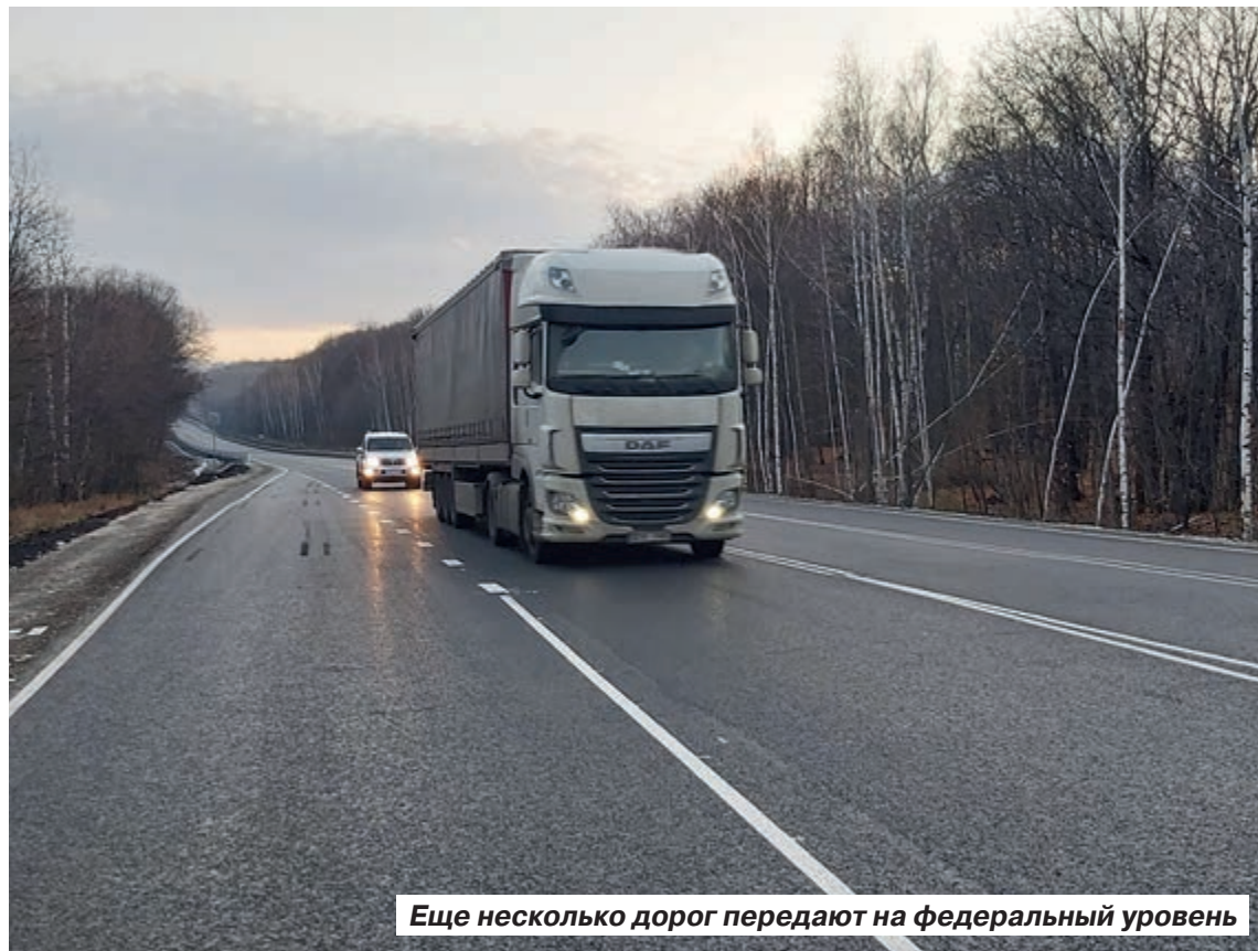
Еще несколько дорог передают на федеральный уровень

– Эту региональную дорогу мы планируем передать на федераль-