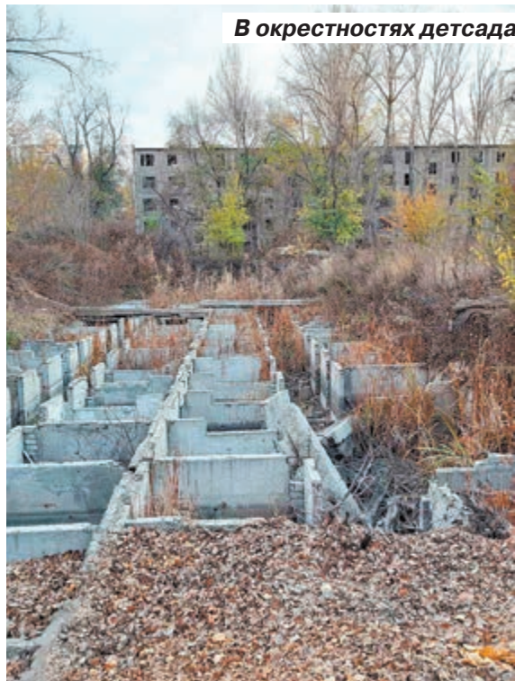
В окрестностях детсада на пустыре дети нашли труп

Лишь после случая со школьницей Лизой власти города обратили внимание на многочисленные жалобы жителей улицы