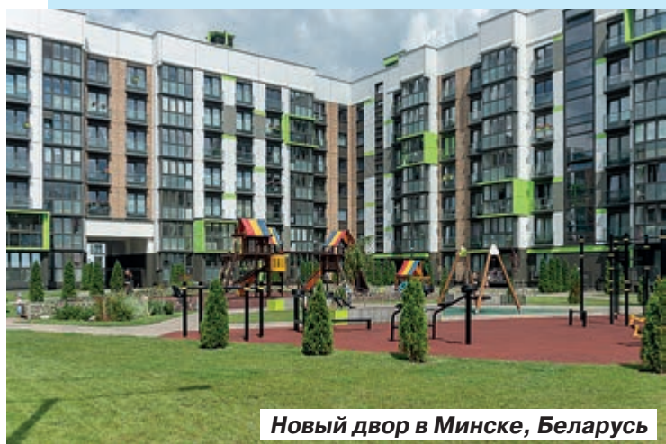
Новый двор в Минске, Беларусь

Илья Варламов утверждает, что многоэтажные «гетто», строящиеся в полях (и не только), неизбежно будут сноситься, и начнется это гораздо раньше, чем нам представляется.