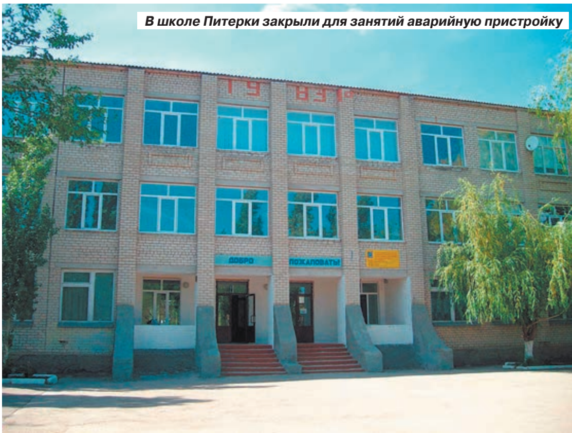
В школе Питерки закрыли для занятий аварийную пристройку

Из-за экстренной смены расписания уроков возникла неразбериха с кабинетами. Первоклашкам несколько раз приходилось даже учиться в актовом зале, потому что помещений на всех не хватило! Хотя самым маленьким положено заниматься только в своей, отдельной классной комнате. По этой же причине трудно организовать продленку.