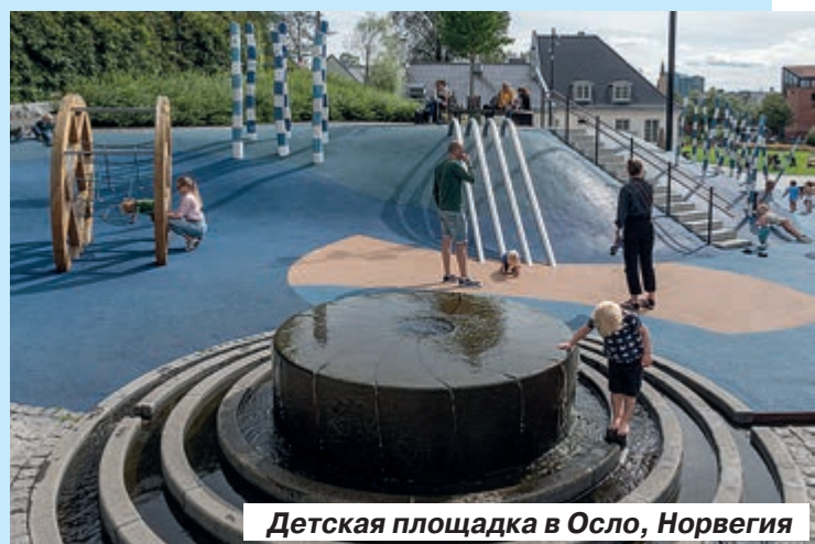
Детская площадка в Осло, Норвегия