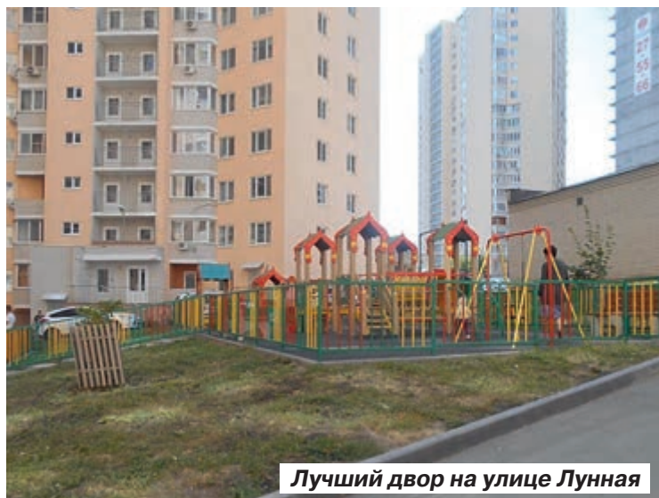
Лучший двор на улице Лунная

n_f_style_id: «Жаль, что на дома СЖФ в центре города, Челюскинцев – Рахова, не обращают вообще никакого внимания. Там люди живут в грязи и разрухе, сами убирают дворы – осенью от листьев, а зимой от снега, сами за свой счет покупают асфальтовую крошку, потому что водоканал не «убрал» за собой после раскопок. Крышу в этих домах не ремонтировали ни разу! Как жить после последствий прошлой зимы, не-