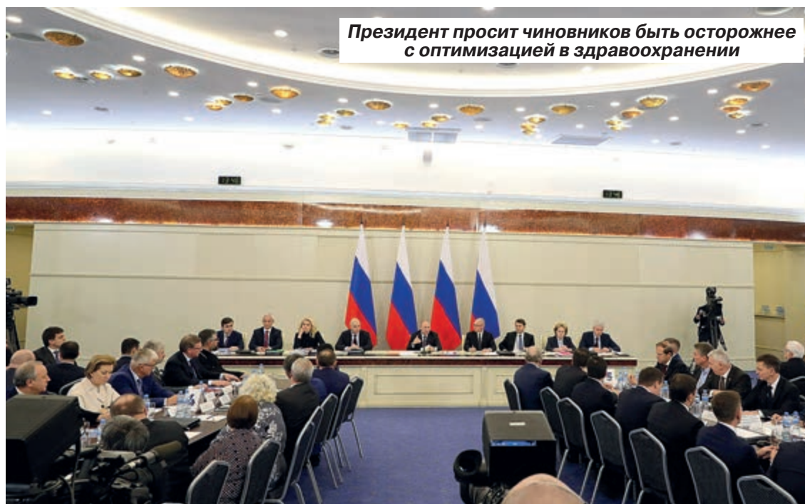
Президент просит чиновников быть осторожнее с оптимизацией в здравоохранении

Отчет держала министр здравоохранения России Вероника Скворцова. Со своей стороны она подтвердила успехи российского здравоохранения, которые особенно ярко выражаются в циф-