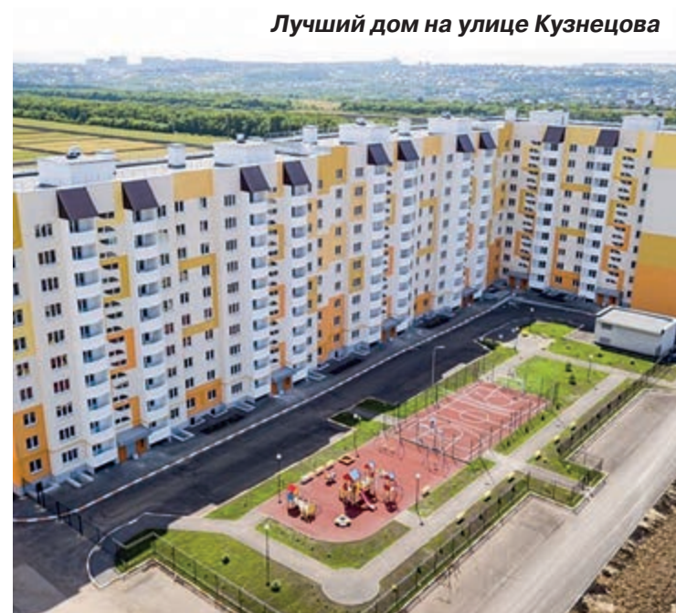
Лучший дом на улице Кузнецова

darianka313: «Здорово! Есть дворы, в которые вы вкладываетесь! А есть те, на которые вам