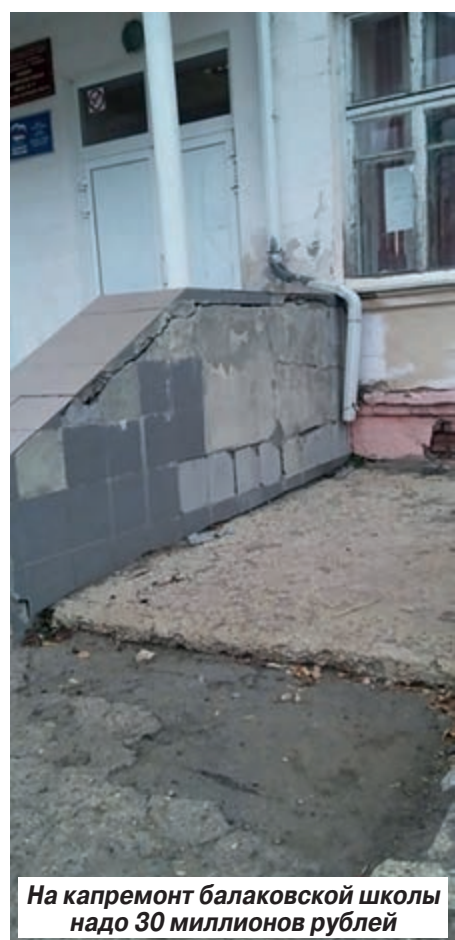
На капремонт балаковской школы надо 30 миллионов рублей

Кстати, такая же тупиковая ситуация сложилась и со школой № 4 в Балакове. Только в данном случае во все колокола бьют родители учеников, а не администрация учебного заведения. За последний год горожане выложили несколько постов в соцсетях о плохом состоянии здания школы. И вроде бы застройку приводят в порядок, однако балаковцы сообщают, что даже после того, как трещины на стенах заделали зимой, они снова появились. С фасада отваливается штукатурка, а с крыльца падает вновь прилепленная наспех плитка. Чиновники отчитываются о проделанных косметических ремонтах, только состояние здания от этого не становится лучше.