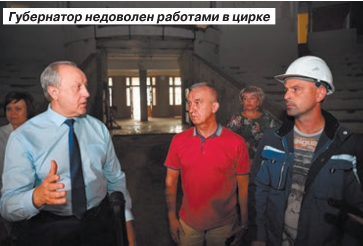
Губернатор недоволен работами в цирке