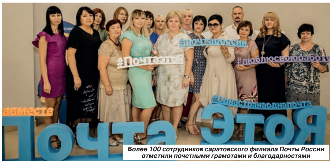
Более 100 сотрудников саратовского филиала Почты России отметили почетными грамотами и благодарностями