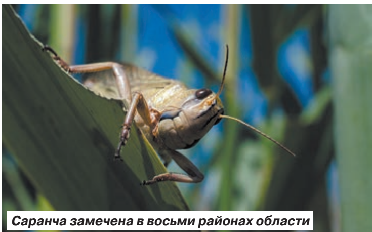
Саранча замечена в восьми районах области