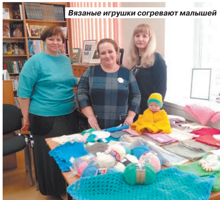
Вязаные игрушки согревают малышей

Одежда для младенцев не имеет швов, которые могли бы травми-