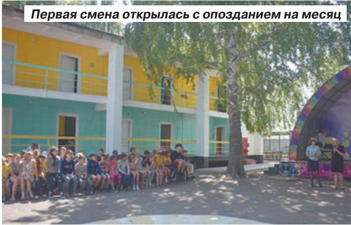
Первая смена открылась с опозданием на месяц

Тысячи саратовских детей не смогли в начале лета отдохнуть за городом. Оздоровительные лагеря в Саратове и его окрестностях были закрыты. Тем временем медицинские учреждения заполняли пациенты с подозрением на ГЛПС. В настоящее время известно, что диагноз геморрагической лихорадки с почечным синдромом подтвержден у более чем 500 человек.