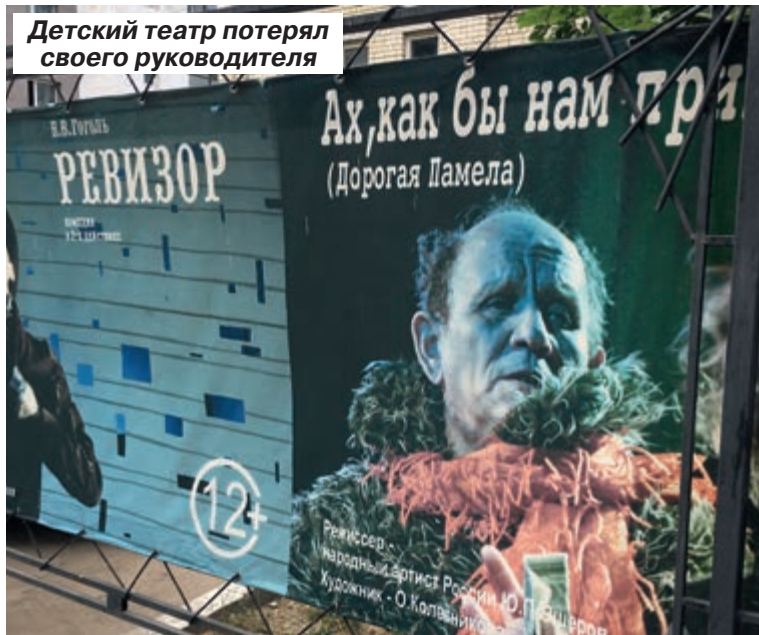
Ошерева проводили слезами и аплодисментами