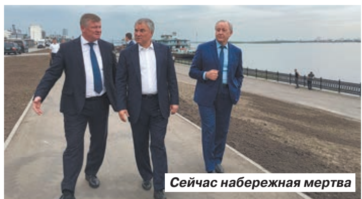
Сейчас набережная мертва

Володин возмущен планировкой нового пляжа и застройкой жилых микрорайонов Саратова