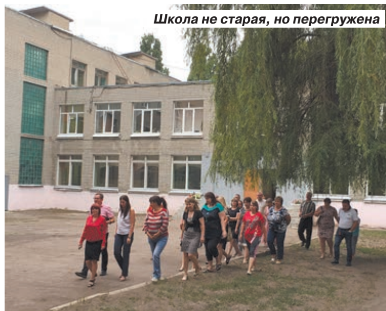
Школа не старая, но перегружена

В новом здании нужно предусмотреть все то, чего сейчас так остро не хватает учителям и детям, например, большую столовую, актовый зал, дополнительные классы. Во дворе обязательно