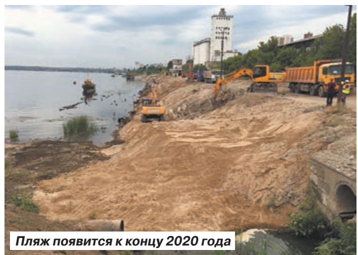
Пляж появится к концу 2020 года

Как ни сумбурно звучит, согласно контракту пляж в Саратове должен появиться в ноябре 2020 года. По словам губернатора, с вводом объекта будет завершено большое восьмикометровое пешеходное кольцо, объединяющее Волгу, улицу Рахова, проспект Кирова и Волжскую.