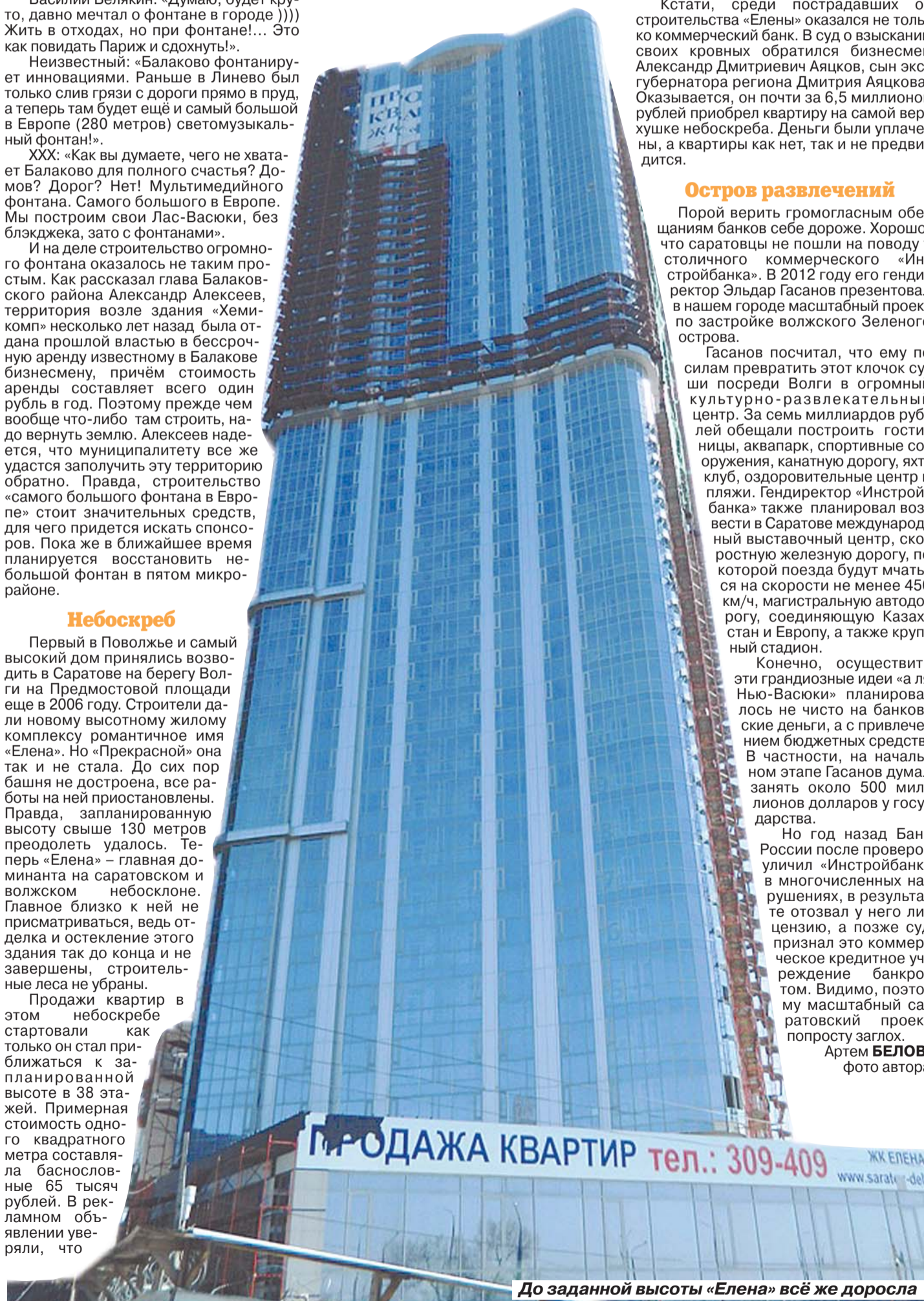
До заданной высоты «Елена» всё же доросла