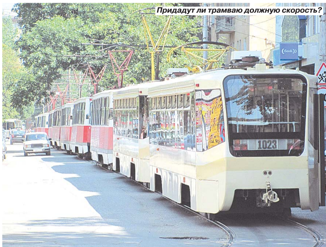
Придадут ли трамваю должную скорость?

Недавно в администрации Саратова в очередной раз обсуждали перспективы развития общественного городского транспорта. Сошлись во мнении, что решить накопившиеся транспортные проблемы города можно тремя путями: провести