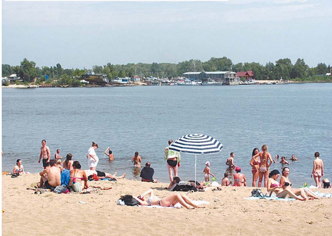
Там, на Зелёном острове, обещали море развлечений

Но в очередные планы на саратовский зоопарк вернется с трудом.