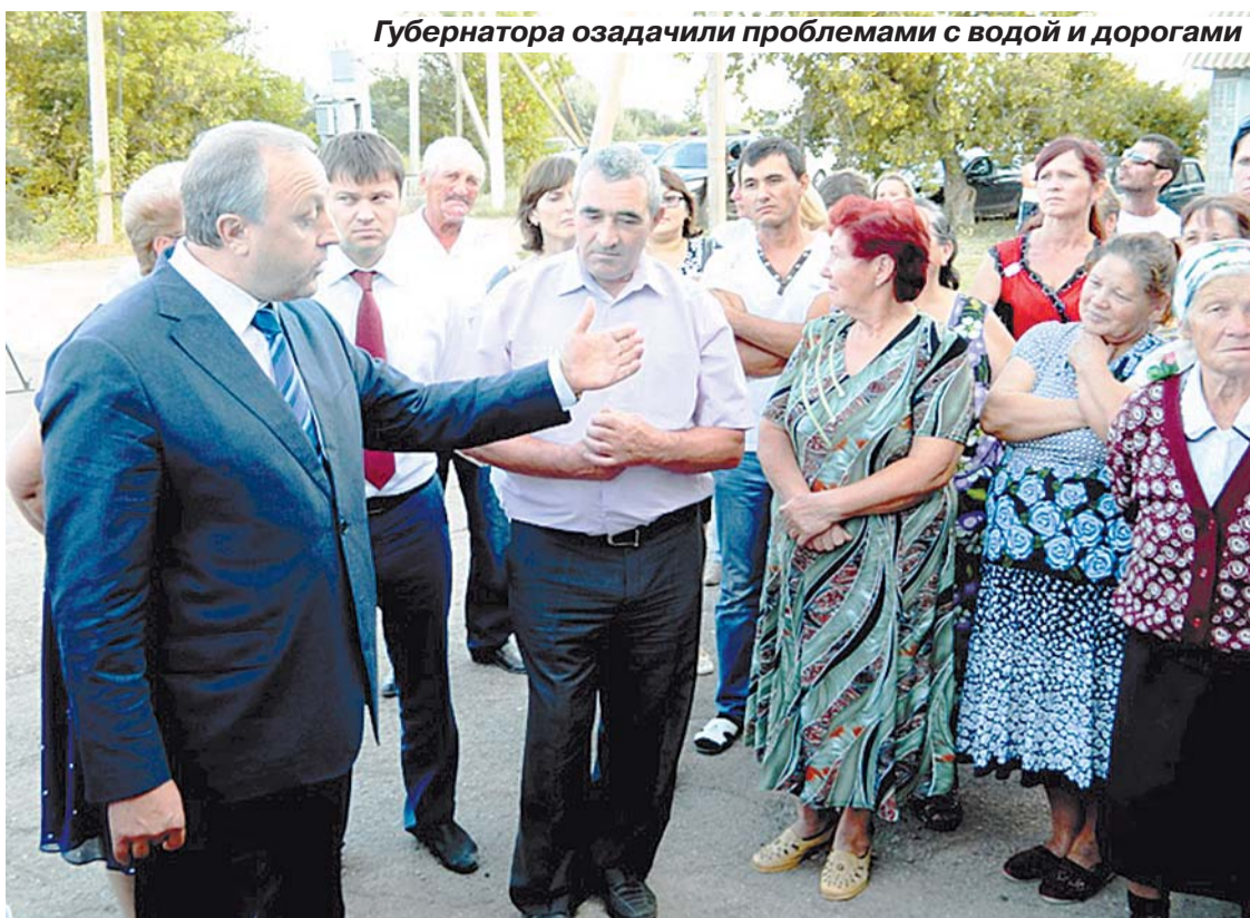
Губернатора озадачили проблемами с водой и дорогами

– Всю жизнь так и живем. Уже даже привыкли, – горестно