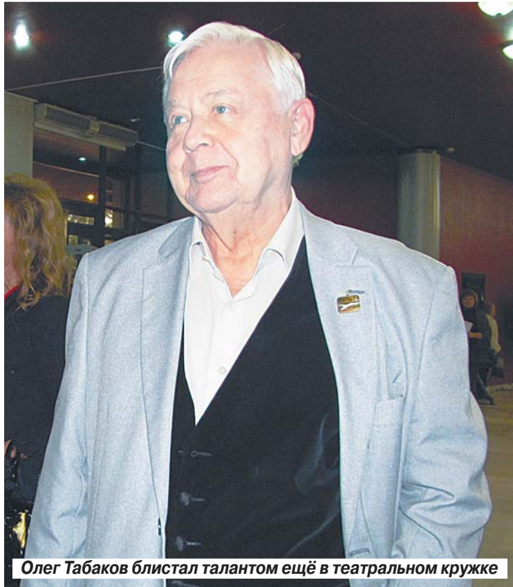
Олег Табаков блистал талантом ещё в театральном кружке