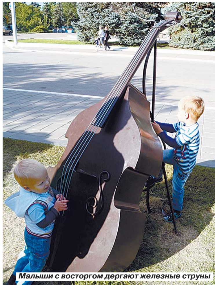
Малыши с восторгом дергают железные струны

Тренировала музыкальный слух Екатерина ГОЛУБЕВА