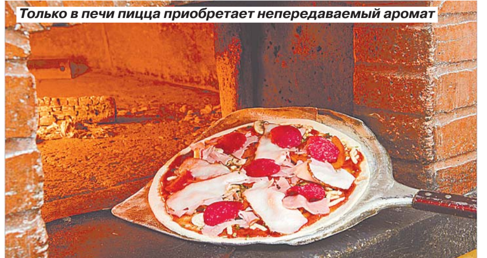
Только в печи пицца приобретает непередаваемый аромат

ГОРИЗОНТАЛЬ: Смокинг. Драма. Окрас. Острога. Ясень. Шериф. Серебро. Лесоповал. Рада. Тлен. Лыжа. Рог. Рокот. Греча. Уфа. Алекс. Балет. Зло. Вассал. Штамп. Сердце. Ривз. Ночь. Яство. Согло. Кадр. Пирс. Фея. Бытие. Гарфилд. Клуша. Шок. Рында. Чайхана. ВЕРТИКАЛЬ: Мастер. Короед. Нагар. Акселерат. Парис. Рассол. Монтаж. Рено. Фото. Равенство. Барабас. Отгул. Вырез. Лассо. Кнут. Тайм. Гавань. Феодал. Клов. Алеко. Шея. Ауг. Прок. Зарядка. Сургуч. Собор. Питон. Опека. Афиша. Делон. Саша. Рай. КЛЮЧЕВОЕ СЛОВО: ГОРИЗОНТ.