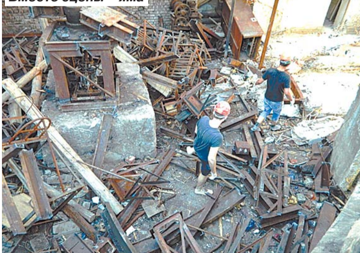
Вместо сцены – яма