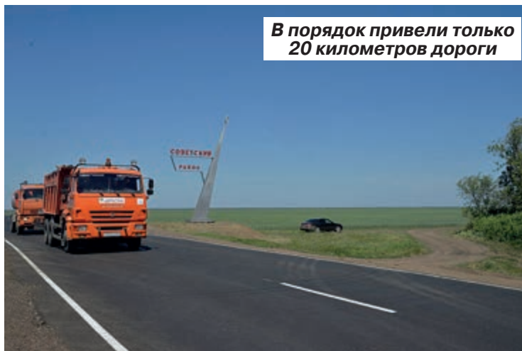
В порядок привели только 20 километров дороги

Глава региона Валерий Радаев выразил слова благодарности председателю Госдумы Вячеславу Володину за поддержку в вопросе передачи автомобильной дороги