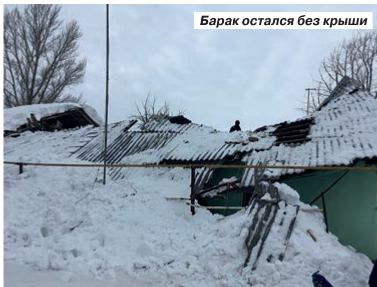
Барак остался без крыши

Нынешняя зима показала строителям суровый нрав. Неоднократно то сильные морозы, то обильные снегопады приостанавливали работы по кирпичной кладке. В настоящее время застройщик уверяет, что темпы нарастали и строительство идет по графику.