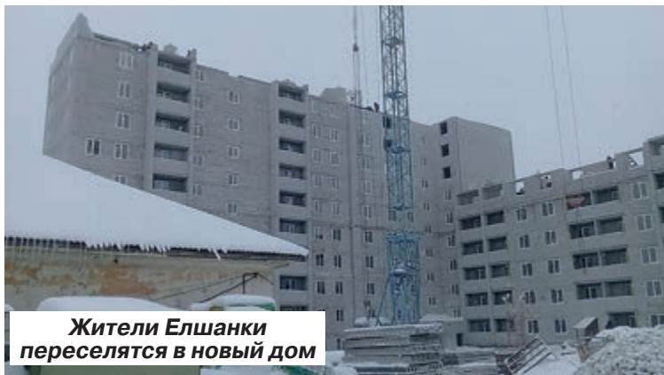
Жители Елшанки переселятся в новый дом

Крыша обрушилась в доме № 3 на 1-ой Лагерной улице в Елшанке. По экстренному вызову на место ЧП прибыли службы МЧС, представители администрации, прокуратуры. Явились и сотрудники управляющей компании «ЖилЦентр», которая, по идее, должна была обслуживать данный дом. Но, по мнению властей,