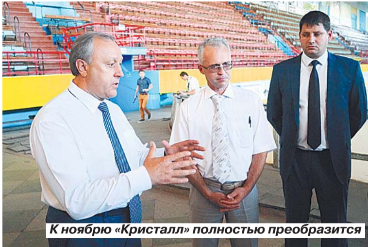
К ноябрю «Кристалл» полностью преобразится

Однако горевать «Кристаллу» о своей печальной участи осталось недолго. Поворотным событием в судьбе ледового дворца стала не игра расквартированного здесь хоккейного клуба «Кристалл», а 1-е место в чемпионате России среди команд суперлиги, которое занял по итогам игрового сезона 2013-2014 годов... баскетбольный клуб «Автодор». Этой победой саратовские баскетболисты обеспечили себе участие в чемпионате «Единой лиги ВТБ». В соответствии с регламентом спортивное сооружение для проведения игр такого высокого уровня должно вмещать не