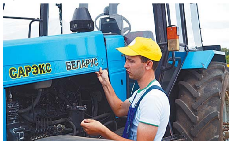
Перед работой агрегат следует тщательно проверить

Почитая славную воинскую историю нашей страны, специальный федеральный закон установил дни воинской славы и памятные даты России. В этом календаре свое отражение нашло и одно из главных сражений в ходе Северной войны – битва у мыса Гангут 1714 года. В этом году, 9 августа, отметили 300-летний юбилей Дня победы в Гангутском сражении – первой в российской истории морской виктории русского флота под командованием Петра I над шведами.