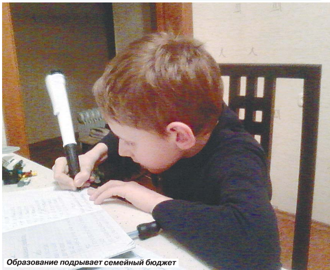
Образование подрывает семейный бюджет

Сейчас нет единых учебников, по которым гранит науки постигали бы одновременно все школьники страны. Каждое образовательное учреждение имеет право самостоятельно выбирать программу и под нее приобретать соответствующие книги. Здесь тоже есть свои подводные камни – скажем, три части математики для 3-го класса учебно-методического комплекса «Перспектива» обойдутся школе в 484 рубля, а их аналог, но только УМК системы Занкова, уже в 510 рублей. Поэтому учеб-