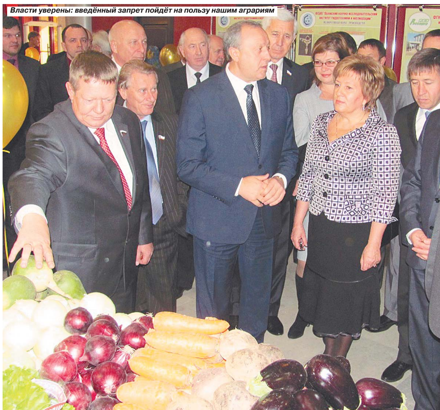
Власти уверены: введенный запрет пойдет на пользу нашим аграриям

– От этого могут пострадать, на мой взгляд, крупные торговые сети, предпочитающие отечественной продукции импортную. Картофель или мясо из Европы, может, кому-то и интересны, но какой смысл помогать зарубежному фермеру, когда наши, отечественные сельхозтоваропроизводители выпускают про-