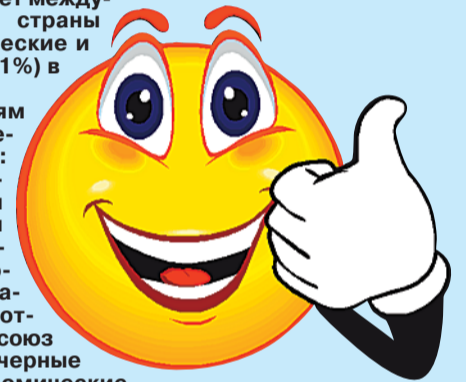
Саратовцев без еды не оставят

Наперекор санкциям западных стран идут и результаты опроса ВЦИОМ: рассчитанный показатель удовлетворенности жизнью среди россиян растет и бьет все рекорды, несмотря на сложности, с которыми сталкивается наша страна. Несмотря на то, что США и Евросоюз постоянно расширяют «черные списки» россиян и экономические санкции против России в связи с украинским кризисом, индекс социального самочувствия за последние три месяца демонстрирует беспрецедентный рост. Индекс удовлетворенности жизнью в июне обновил исторический максимум – 79 пунктов, индекс материального благополучия – 76 пунктов, а индекс социального оптимизма – 77 пунктов.