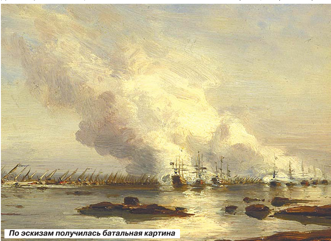
По эскизам получилась батальная картина

Роман ВОРОНЕЖСКИЙ, по материалам Радищевского музея