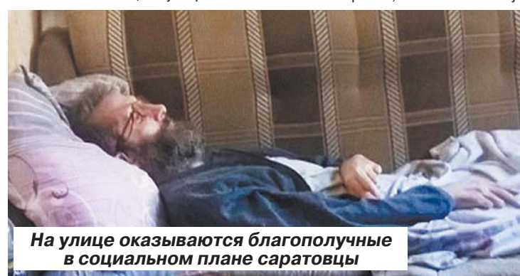
На улице оказываются благополучные в социальном плане саратовцы

Еще одна трагедия брошенного инвалида-колясочника разыгралась в Ленинском районе. Началось все с поста в Фейсбуке. Кто-то из местных жителей запечатлел на фото, как мужчина лежит в сквере на проспекте 50 лет Октября под промокшим от дождя одеялом. Нехитрый скарб, две буханки хлеба в инвалидной коляске. Горожане несколько раз вызвали страдальцу «скорую», полицию. На место выезжали и сотрудники областного министерства соцразвития совместно с представителями Центра БОМЖ. Беспомощному горожани-