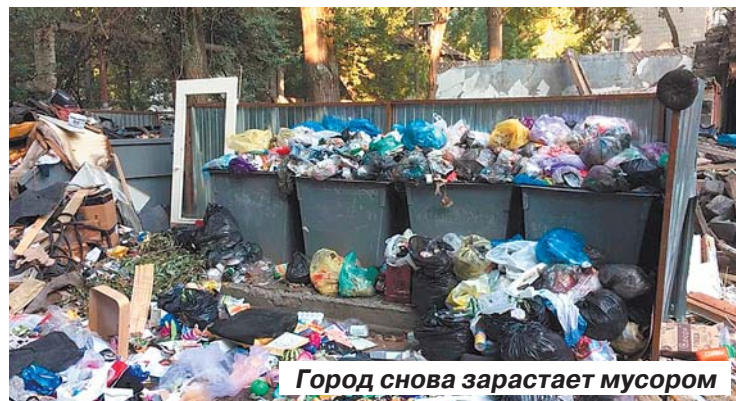
Город снова зарастает мусором