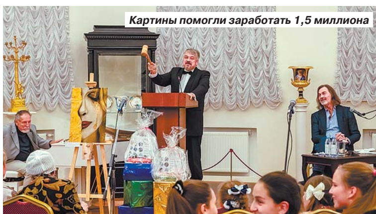
Картины помогли заработать 1,5 миллиона

руководством одного из лучших художников современности.