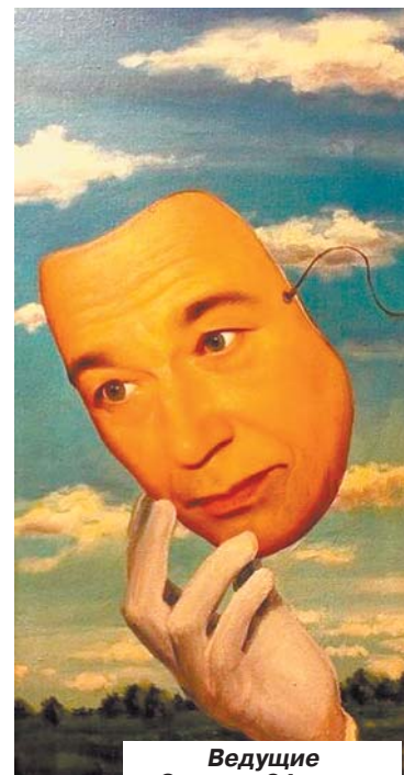
Ведущие «Саратов 24» снова перевоплотились

Марат ГОМОЮНОВ, по материалам «Саратов 24»