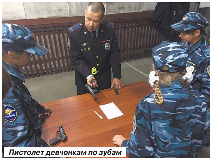
Пистолет девчонкам по зубам

Саратовские школьники знакомятся с «Калашниковым», правом и готовятся к работе в МВД