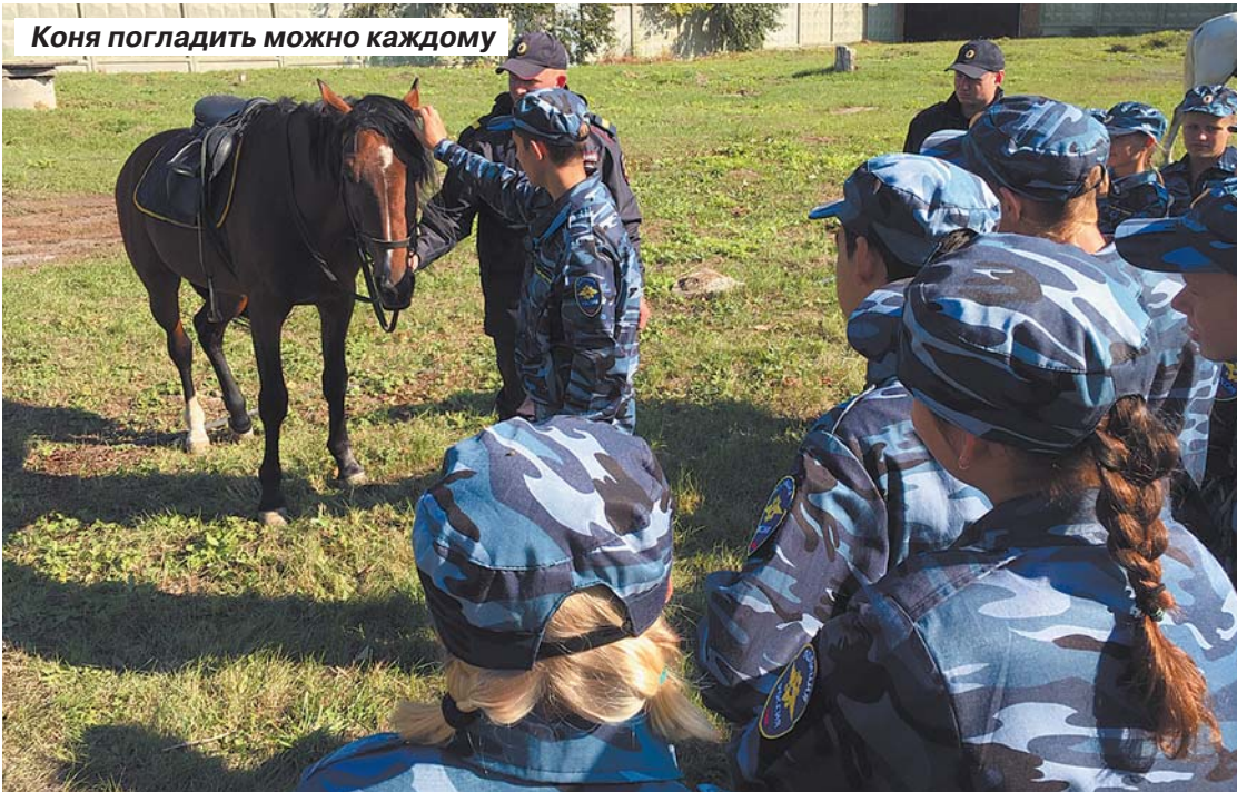
Коня погладить можно каждому