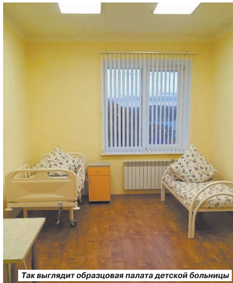
Так выглядит образцовая палата детской больницы

Сейчас, как увидел собственными глазами Вячеслав Викторович, внутри кирпичной коробки прокладывают электропроводку и отопление, ведут отделочные работы. Началось благоустройство прилегающей территории. В качестве образца для гостей подготовили одну палату на третьем этаже. Здесь две кровати, стол, санузел с душем.