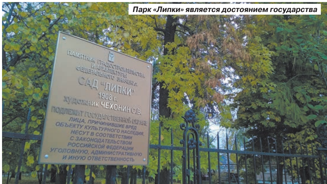
Парк «Липки» является достоянием государства

Роман ВОРОНЕЖСКИЙ , фото автора и «Саратов 24»