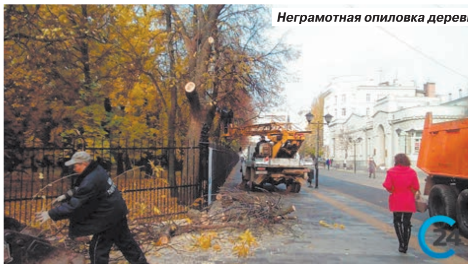
Неграмотная опилковка деревьев может привести к их гибели