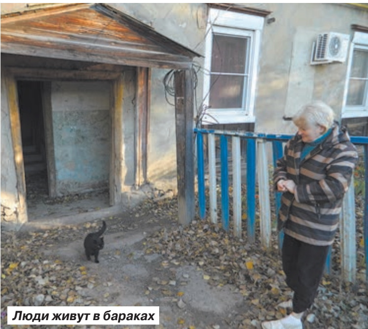
Люди живут в бараках