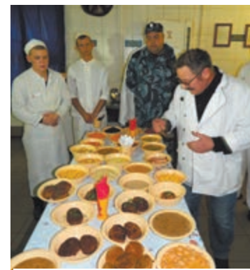
Мастер-класс для колонии

– Очень тяжело приготовить в таком котле, – подтверждает