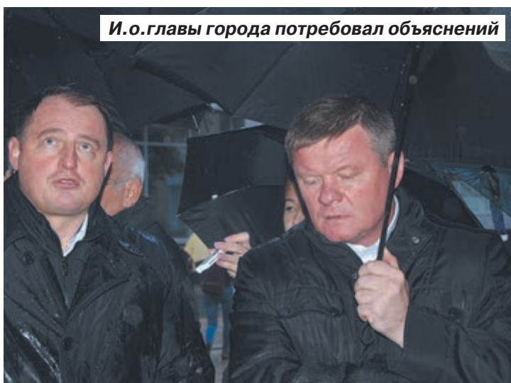
И.о. главы города потребовал объяснений

цией Волжского района, о том, что «липы обрезаны в целях омоложения», общественность несколько не удовлетворил. Эксперты отмечают, что на деле противозаконной опилковке подверглись молодые здоровые деревья, у части которых срезана вся крона, при этом спил ствола не обработан антисептиками.