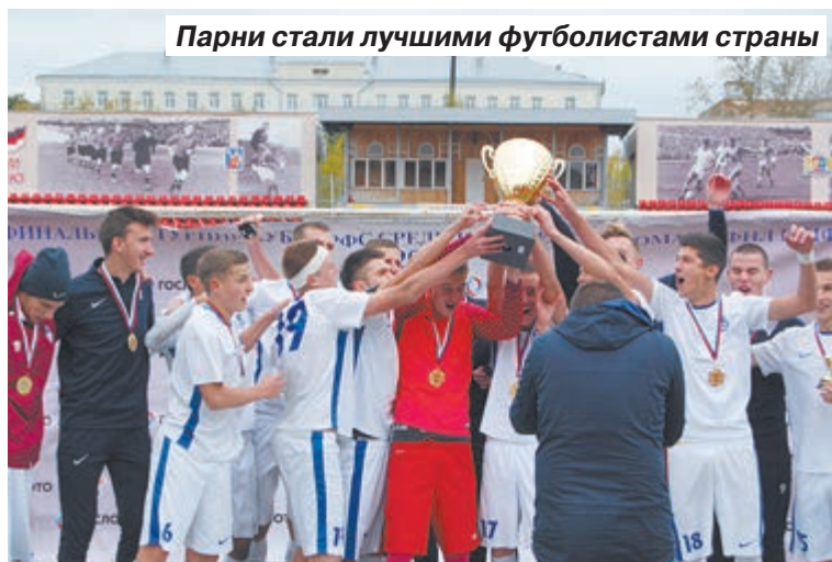
Парни стали лучшими футболистами страны

– Из соображений экономии приходилось останавливаться в та-