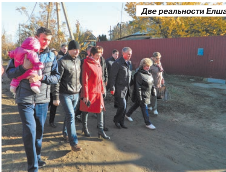
Две реальности Елшанки и Комсомольского

– Когда будут расселяться наши дома? – задала она вопрос Володину.