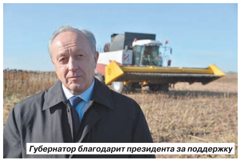
Губернатор благодарит президента за поддержку

Марат ГОМОЮНОВ