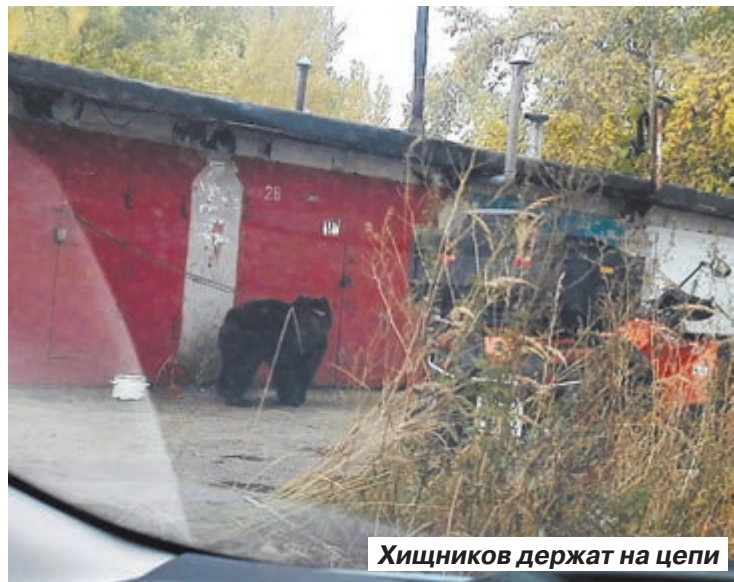
Хищников держат на цепи

В одном из балаковских пабликов «ВКонтакте» кто-то из пользователей выложил фото двух медведей. Примечательно то, что звери были привязаны на цепочку к замку ворот одного из боксов местного гаражного кооператива. Один Топтыгин, судя по фото, еще маленький. А вот второй косолапый уже довольно взрослая особь – ростом мишка вымахал до середины гаражных ворот.