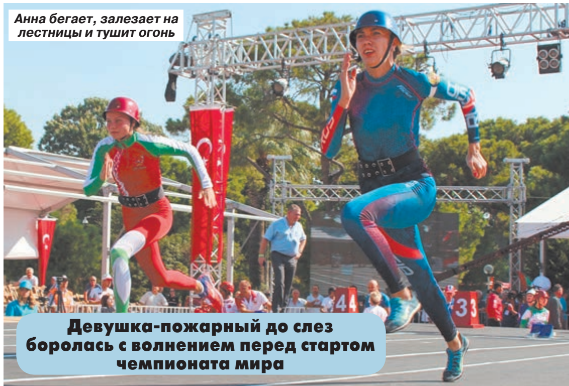
Девушка-пожарный до слез боролась с волнением перед стартом чемпионата мира