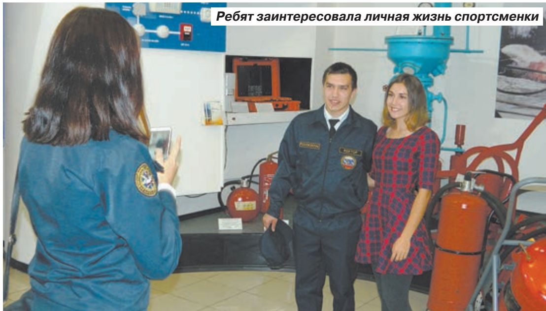
Ребят заинтересовала личная жизнь спортсменки

Артем БЕЛОВ, фото автора и Федерации пожарно-прикладного спорта