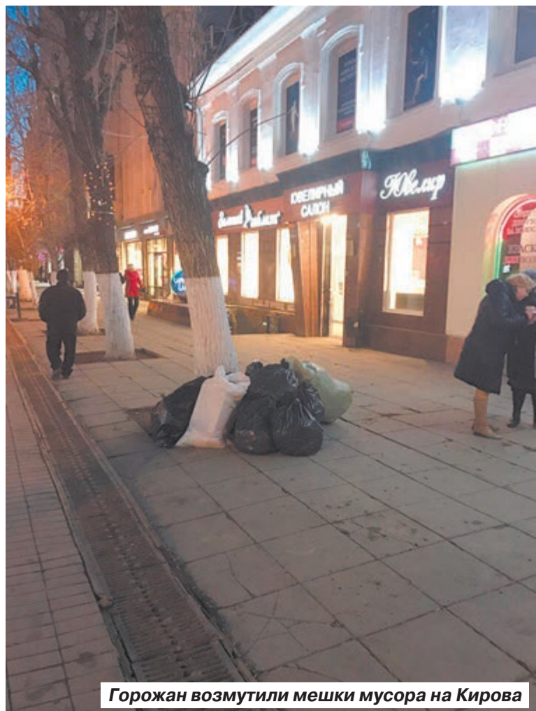
Горожан возмутили мешки мусора на Кирова

Роман ВОРОНЕЖСКИЙ , фото автора и с сайта проекта ОНФ