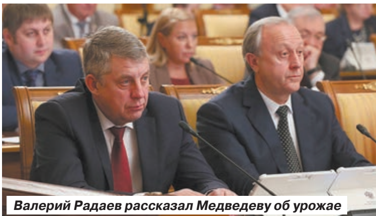
Валерий Радаев рассказал Медведеву об урожае

Сбор сахарной свеклы составил 52 миллиона тонн. Такой рекордный урожай позволит произвести 6,5 миллионов тонн сахара и сохранить мировое лидерство в этом сегменте. В сезоне 2016-2017 годов Россия вышла на первое место в мире по производству свекловичного сахара, опередив такие страны, как Франция, США, Германия.