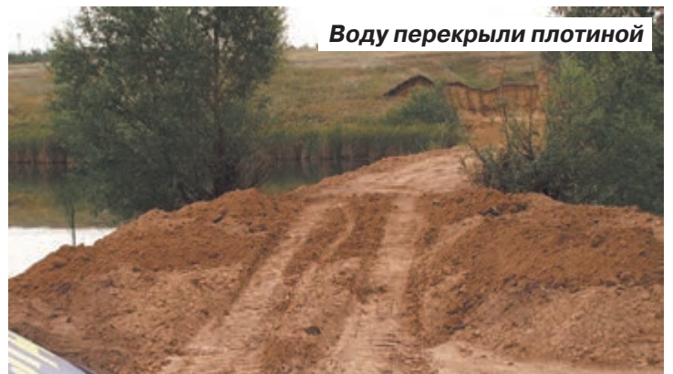
Воду перекрыли плотиной

Сперва участок земли вместе с водоёмами был продан пред-