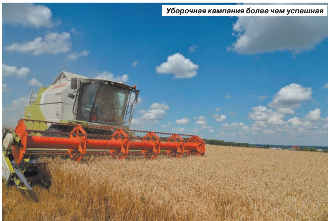
Уборочная кампания более чем успешная

– Уже к 2030 году мы можем получить не 120, а 150 миллионов