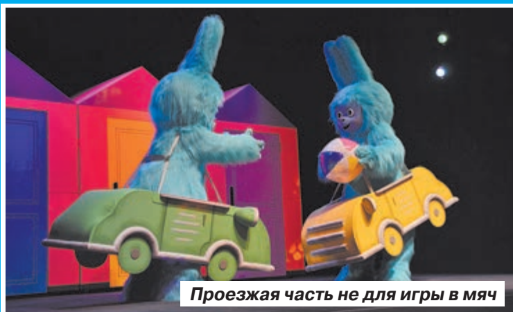
Проезжая часть не для игры в мяч

В один прекрасный день звери проснулись, умылись и решили, что неплохо было бы сыграть в мяч прямо на... проезжей части оживленной автомагистрали. Нет, это вовсе не завязка триллера или ужастика для особо впечатлительных натур. Так начинается поучительная сказка о том, как правильно вести себя на дороге, которую подарил своим самым маленьким зрителям на открытии очередного сезона саратовский театр кукол «Теремок».