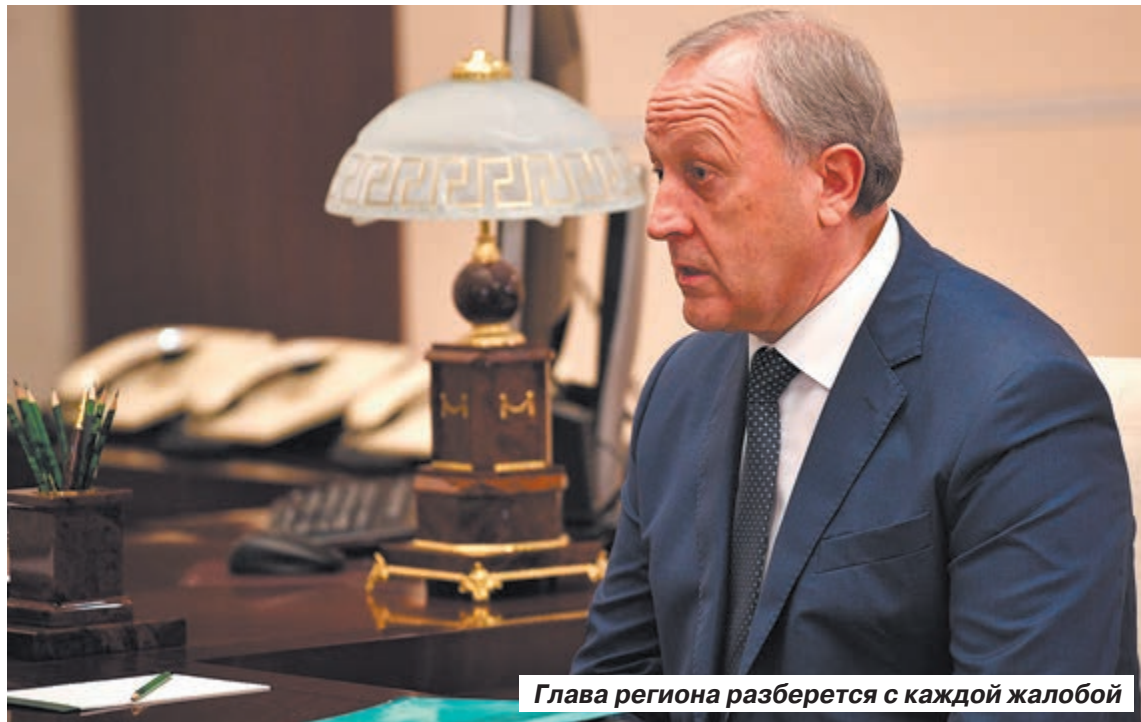
Глава региона разберется с каждой жалобой

Масштабы работ понятны, есть «дорожные карты». Мы системно занимаемся дорогами Саратовской области.