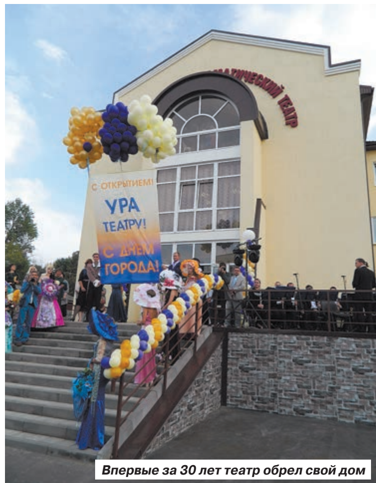
Впервые за 30 лет театр обрел свой дом