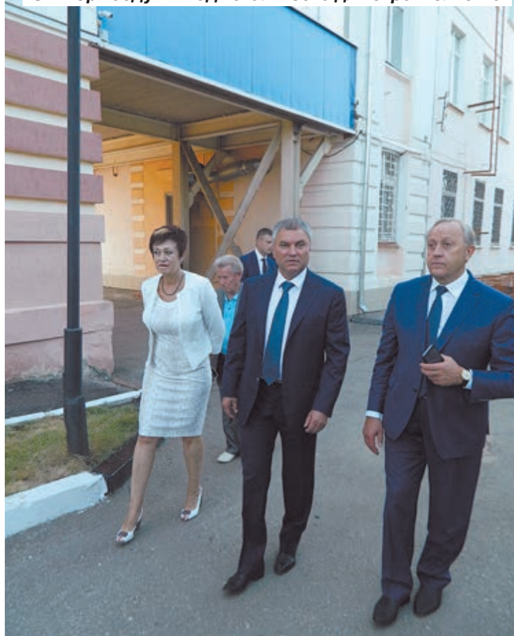
Спикер Госдумы подыскал место для строительства

все, чтобы Саратовская область развивалась, чтобы Саратов был краше.