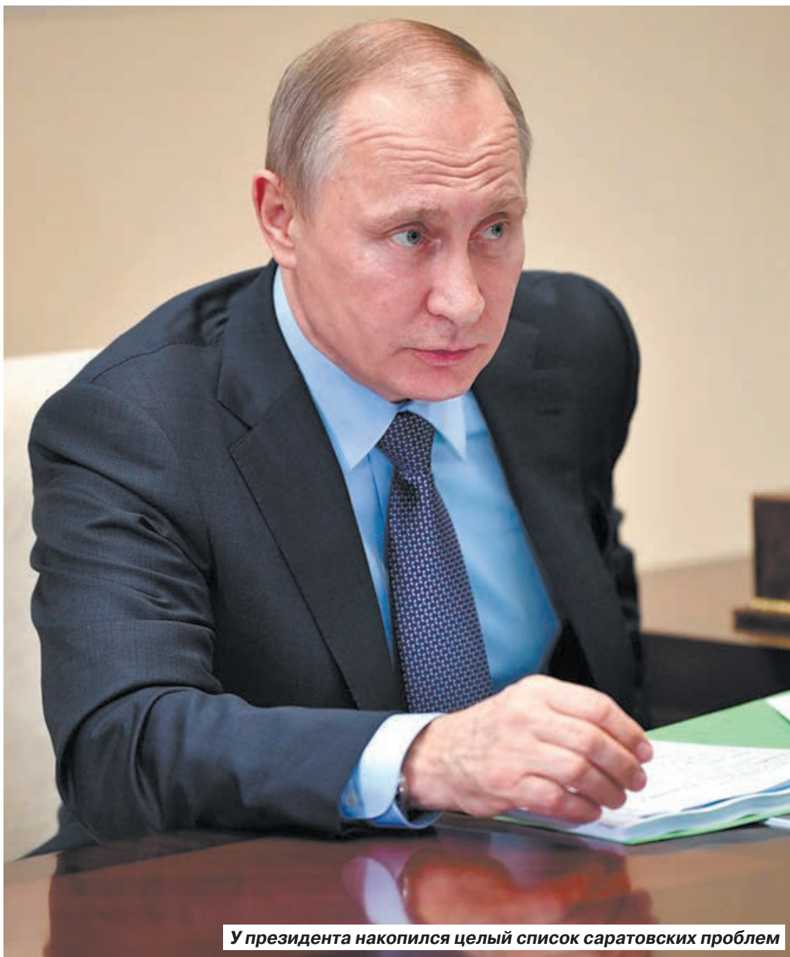
У президента накопился целый список саратовских проблем