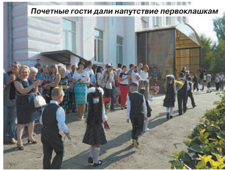
Почетные гости дали напутствие первоклашкам

– Мы с вами должны сделать все, чтобы наши дети получали самые лучшие знания, чтобы они состоялись в жизни и дальше делали