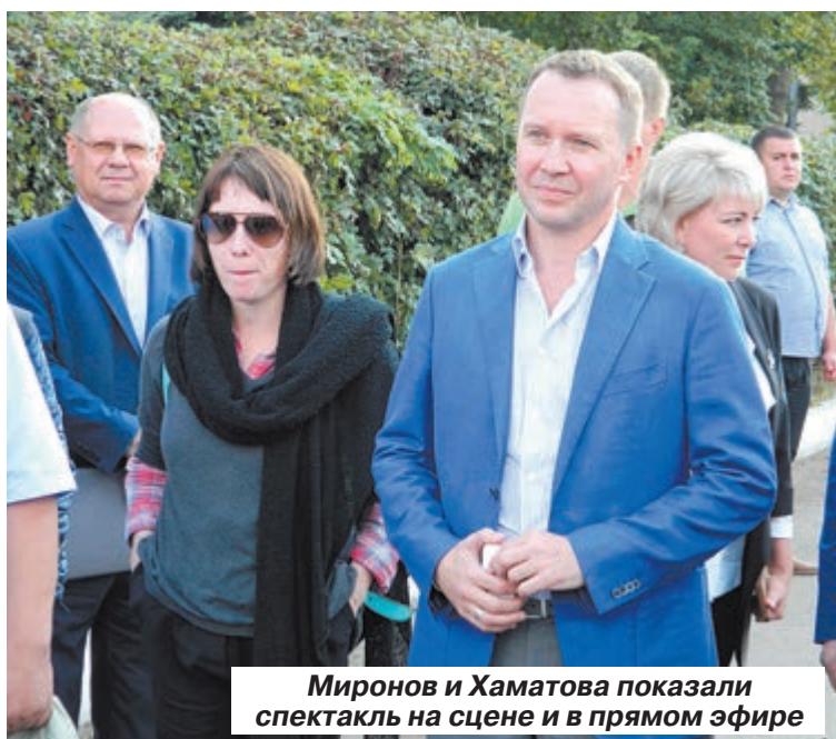
Миронов и Хаматова показали спектакль на сцене и в прямом эфире

балашовцы признались главе региона, что до этого момента у них никогда еще не было подобного масштаба мероприятий.