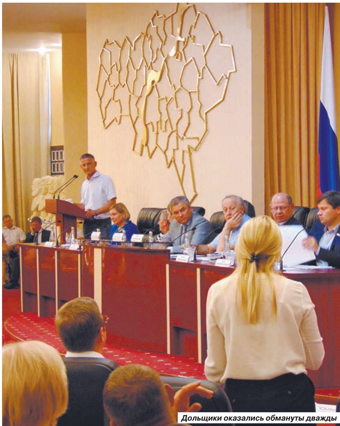
Дольщики оказались обмануты дважды

– ЖСК на Шелковичной. У нас в основном пенсионеры, мы создали свое ЖСК, так как прошлый застройщик обанкротился. Чтобы построить дом, нужен новый про-