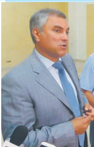
Примеру, у одного застройщика было 16 домов, и вот к чему это привело. Поэтому на будущее такие вопросы зачастую решили.

По ряду заброшенных объектов единого решения проблем обманутых дольщиков в настоящее время нет. До сих пор имеются конфликты внутри самих собственников, идут судебные тяжбы по несуществующим квар-