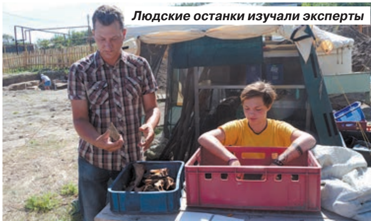
Людские останки изучали эксперты

В традиционном представлении большинства людей лето – это пора отдыха и отпусков. Вот только у краеведов и археологов отдых получается весьма специфическим, потому что проводить лето им приходится, ковыряясь в земле, из которой нет-нет да и удастся извлечь несметные сокровища – старинный крохотный амулет или осколок глиняного сосуда. Благодаря стараниям волонтеров, которых не смущает даже суровая жара, в этом году гостей, которые захотят окунуться в древнее прошлое Увекского городища, ожидает масса сюрпризов, пожалуй, главный из которых – знакомство с обнаруженным буквально в двухстах метрах от фестивальной площадки Укек некрополем.