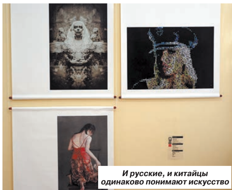
И русские, и китайцы одинаково понимают искусство