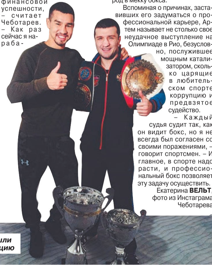
Парни ушли в коммерцию

Екатерина ВЕЛЬТ