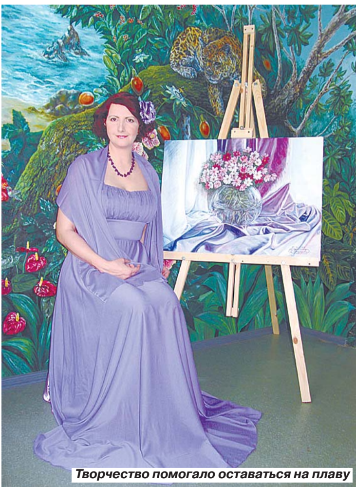
Творчество помогло оставаться на плаву

Картины анималиста можно увидеть в городском музее и ее квартире