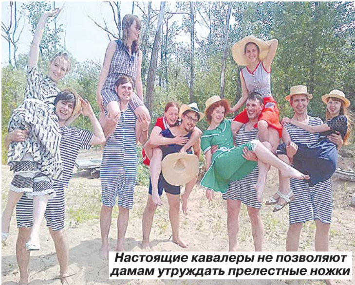
Настоящие кавалеры не позволяют дамам утруждать прелестные ножки

Многие столетия дамам разрешалось окунуться в реку или озеро лишь вдали от посторонних глаз и в рубашках до пола. В середине 19 века общество начало увлекаться пляжным отдыхом, но места для него разделялись на мужские и женские. И где-то в конце того же столетия сильной и слабой половинам человечества разрешили наконец загорать и плескаться вместе. С этого же времени стала развиваться и пляжная мода.