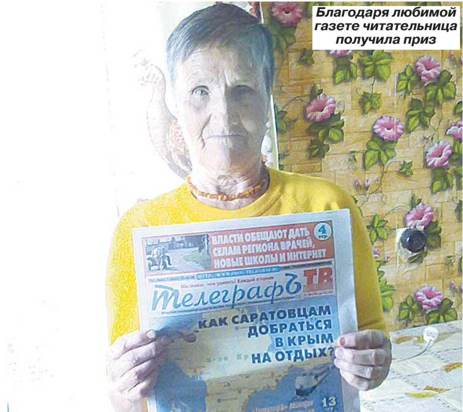
Благодаря любимой газете читательница получила приз

ГОРИЗОНТАЛЬ: Адмирал. Спуск. Техас. Миномёт. Цифра. Жираф. Агрегат. Киносанс. Лоза. Очаг. Слом. Мир. Набег. Ущерб. Буш. Опека. Удача. Ярд. Выборы. Штрих. Гренки. Рейд. Раут. Шкала. Нарез. Пупс. Аист. Сок. Волхв. Публика. Афера. Кон. Канал. Раллист. ВЕРТИКАЛЬ: Джингл. Ирокез. Алёша. Великанша. Фазан. Привес. Сирано. Рига. Фойе. Розенбаум. Гамбург. Торба. Аллея. Сград. Бант. Гоби. Утварь. Ученье. Крой. Дырка. Шиш. Ржа. Храл. Дискант. Каспер. Навык. Рулон. Завал. Усики. Покос. Тура. Бал. КЛЮЧЕВОЕ СЛОВО: ДУБЛИКАТ.