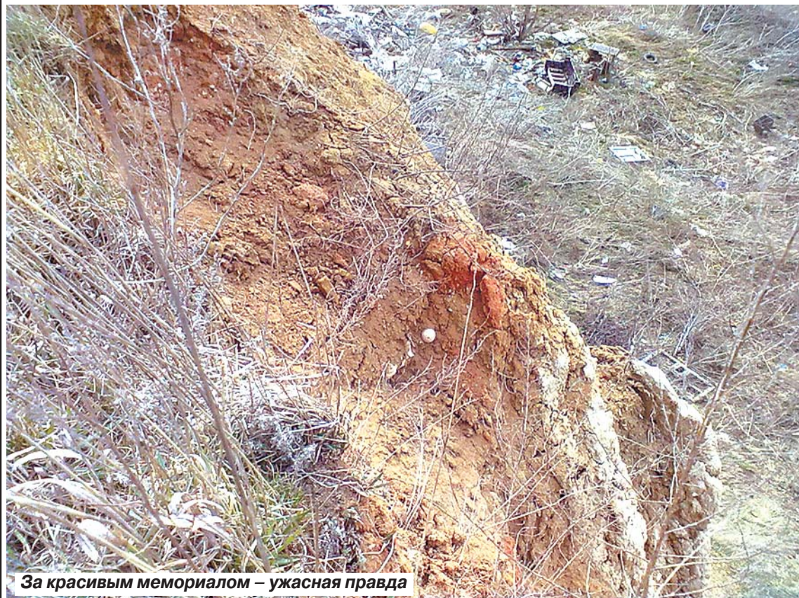
За красивым мемориалом – ужасная правда

Роман ВОРОНЕЖСКИЙ