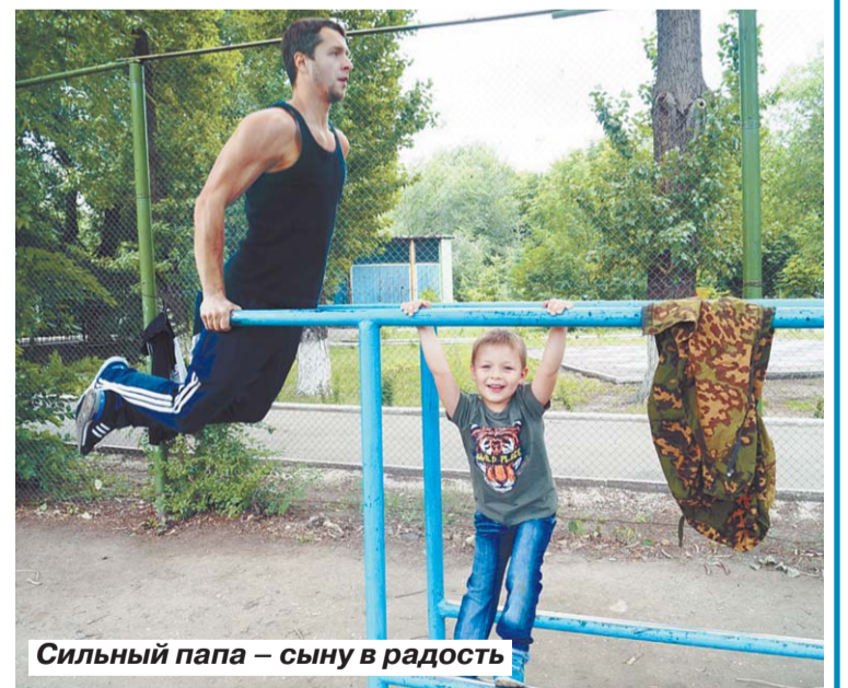
Сильный папа – сыну в радость