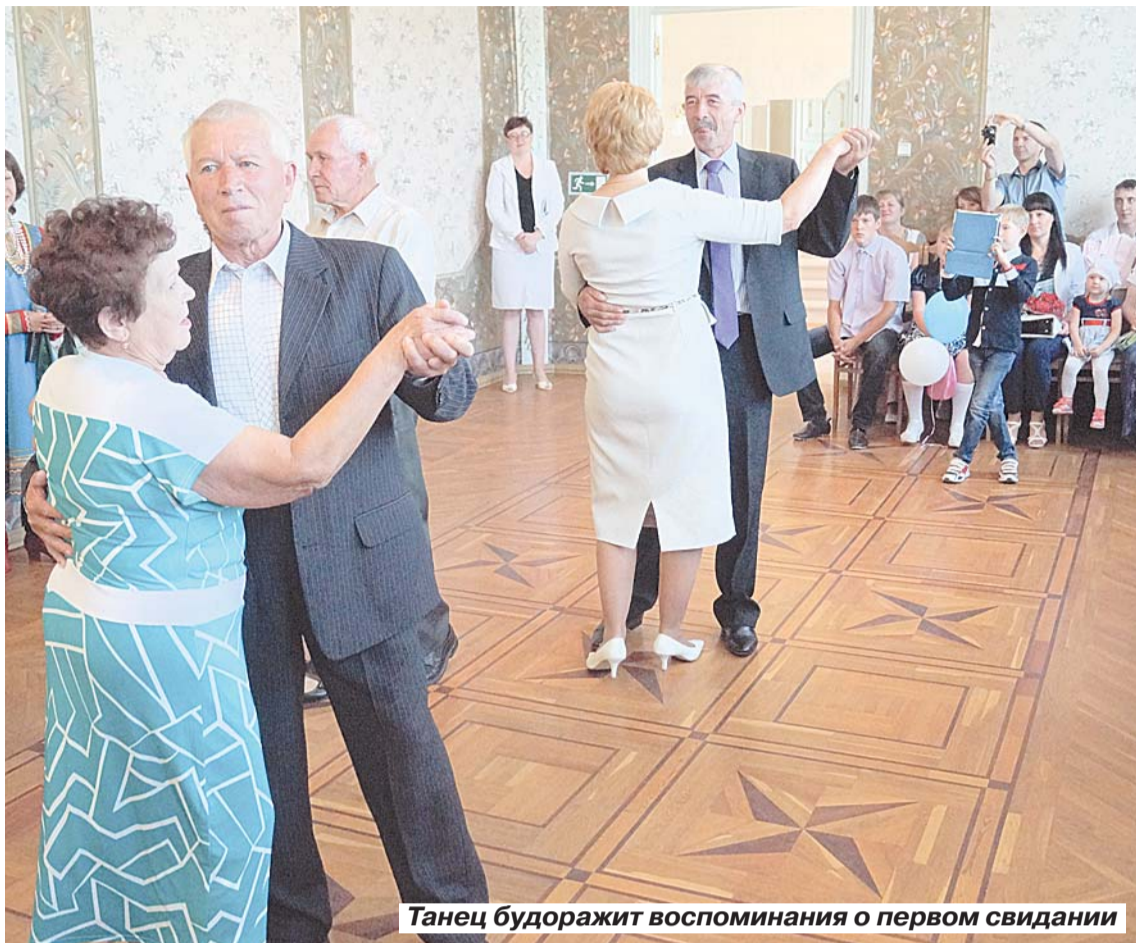
Танец будоражит воспоминания о первом свидании