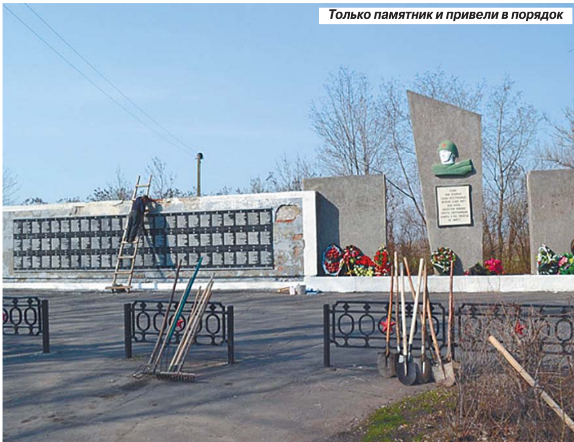
Только памятник и привели в порядок

– На данный момент проделана немалая работа по уборке, благоустройству города. Мы видим результаты, но самая важная для нас оценка – это оценка жителей. Надеемся, она будет