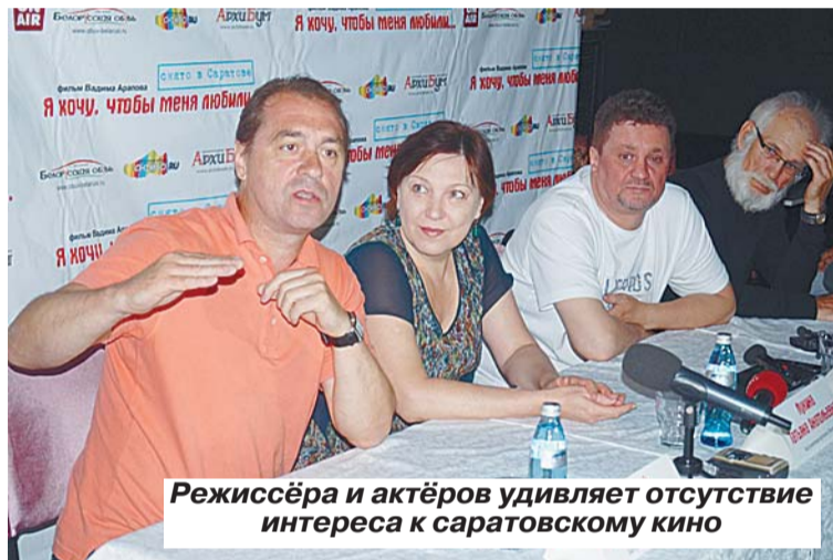
Режиссёра и актёров удивляет отсутствие интереса к саратовскому кино