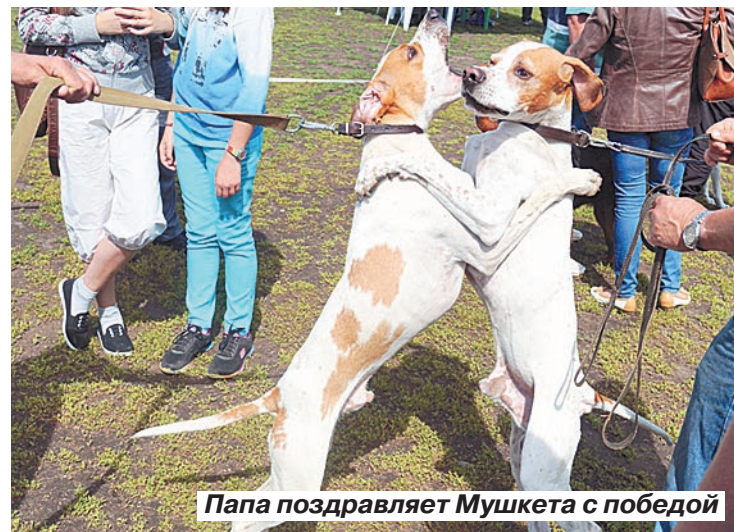
Папа поздравляет Мушкетера с победой

показывает, зовет за собой, приводит к этому месту и опять поднимает дичь. Это свидетельство очень высокого интеллекта. На моей памяти Портос – вторая собака с подобными способностями за сорок лет охотничьей практики. Я этим очень горжусь.