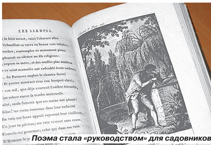
Поэма стала «руководством» для садовников