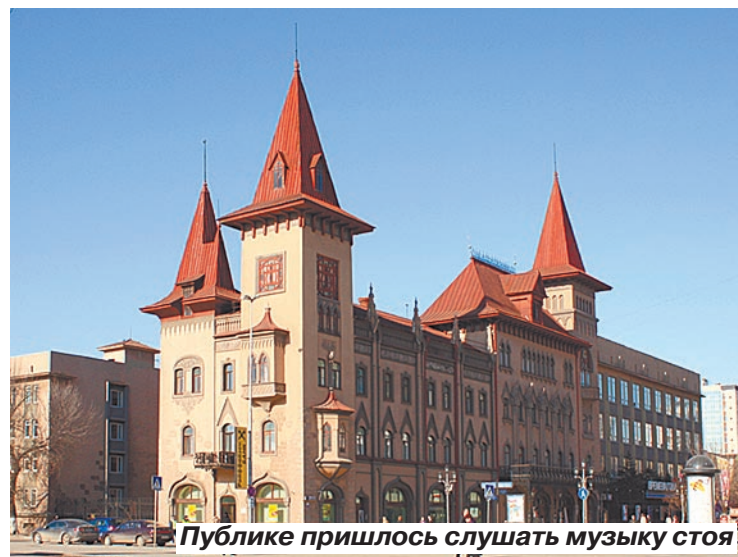
Публике пришлось слушать музыку стоя

вали любимым певцам, заводили знакомства. Сегодня общение на свежем воздухе заменили телевизор, попса и Интернет.