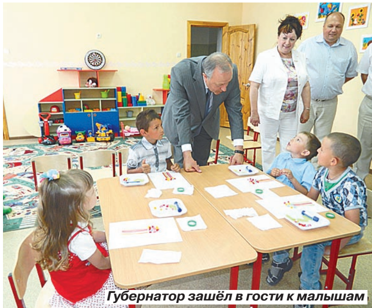
Губернатор зашёл в гости к малышам

Жители постоянно сетовали Радаеву, что жизнь на селе нынче не сладкая, особенно это чув-