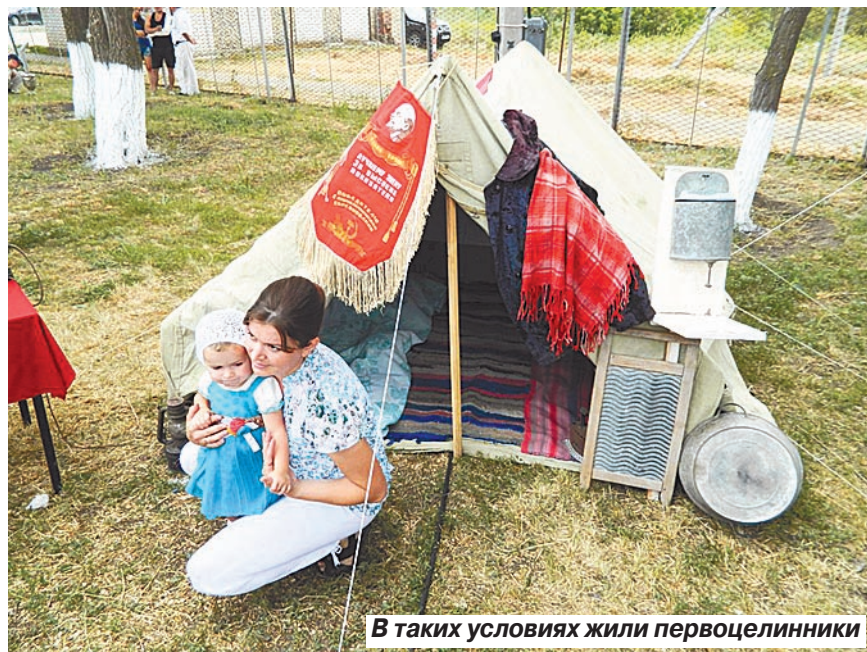
В таких условиях жили первоцелинники

Более полувека назад целинники поднимали залежные земли саратовского Заволжья. Сейчас они снова в запустении