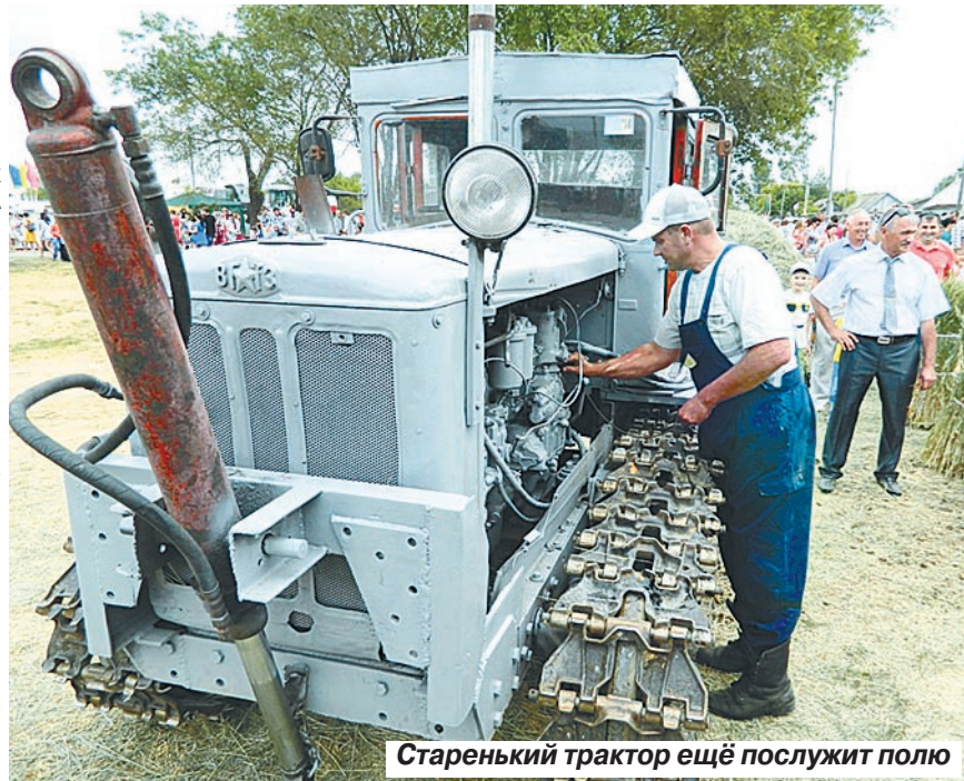
Старенький трактор ещё послужит полю

Пустыри и пашни обошел Артем БЕЛОВ