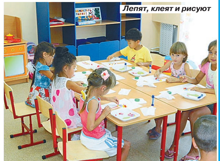
Лепят, клеят и рисуют

Чем собираются аграрии кормить саратовцев, показали на опытно-хозяйстве СГАУ, что возле села Степное. Работы точно хватает с избытком. Студенты си-