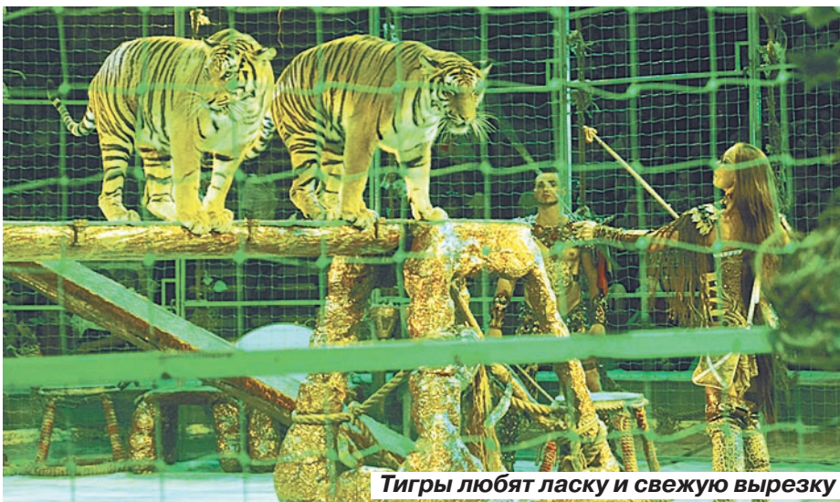
Тигры любят ласку и свежую вырезку