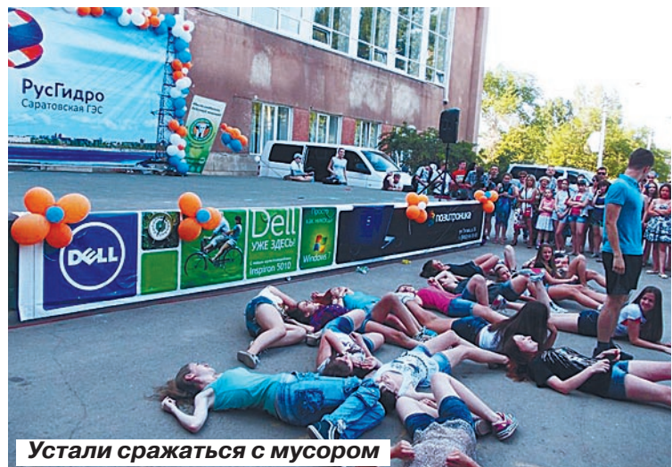
Устали сражаться с мусором

глядели спонтанными, носили абсурдный характер и вызвали недоумение у случайной публики.