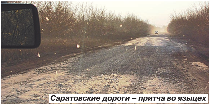
Саратовские дороги – притча во языцех

Казахские власти сетуют на некачественные дороги в Саратовской области