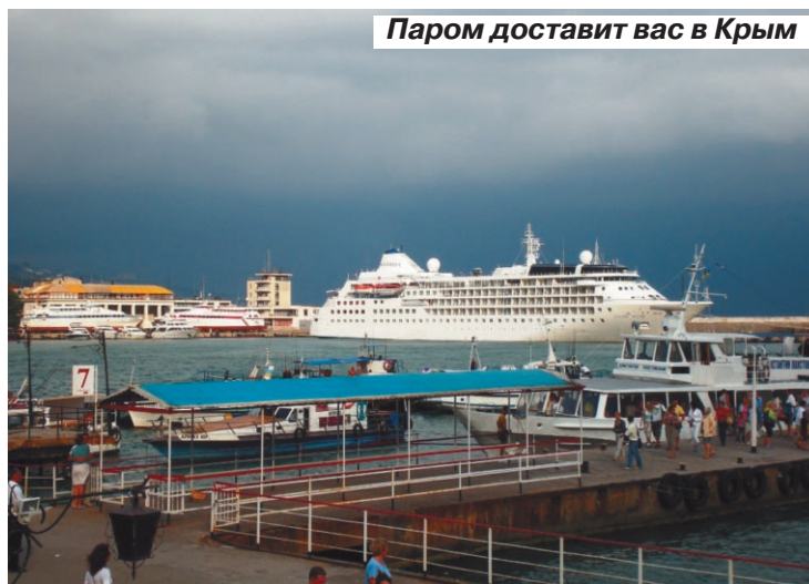
Паром доставит вас в Крым

Вот что отвечают саратовцам в кассах «Саратовских авиалиний» на вопрос о возможности перелета в Крым.