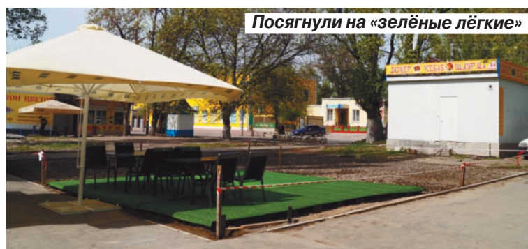
Посягнули на «зелёные лёгкие»

— У нас и так почти ничего не осталось от некогда зеленого сквера, — сетуют жители улицы Астраханской. — Ну ладно, установили спортивную коробку и детскую площадку! От них хотя бы польза есть. Так вокруг построили кафе, шиномонтаж, магазины, букмекерская контора. По кусочку отрезают от сквера, скоро совсем ничего не останется. Теперь, наверно, еще одно кафе хотят открыть. И без того сразу за этим участком стоит лагерь «Донер. Кебаб. Шаурма», далее еще один магазинчик с шаурмой. Сколько их еще открывают?