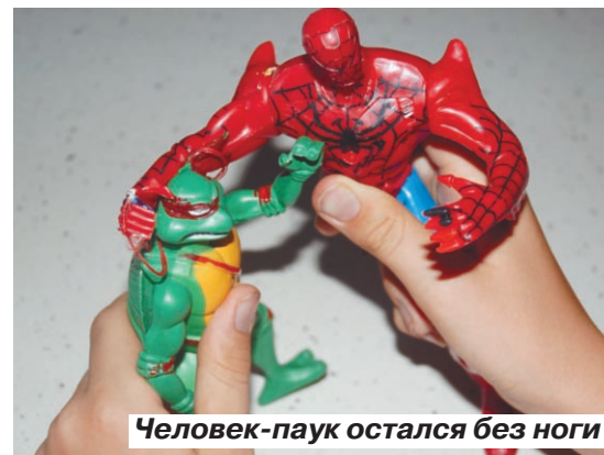
Человек-паук остался без ноги