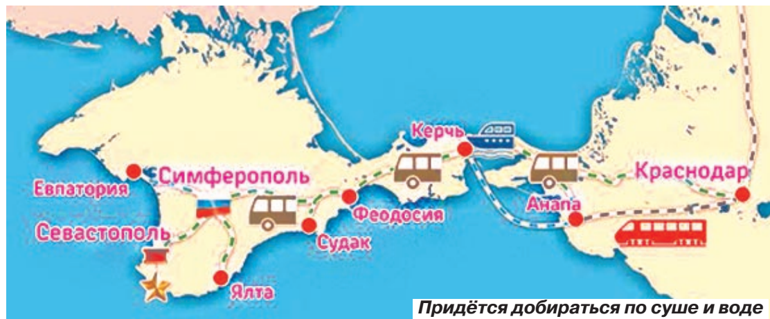
Придётся добираться по суше и воде

Как альтернативу, министерство транспорта и дорожного хозяйства Саратовской области планирует наладить прямое автобусное сообщение между Саратовом и Симферополем. Переговоры об этом ведутся с властями Крыма. Пред-