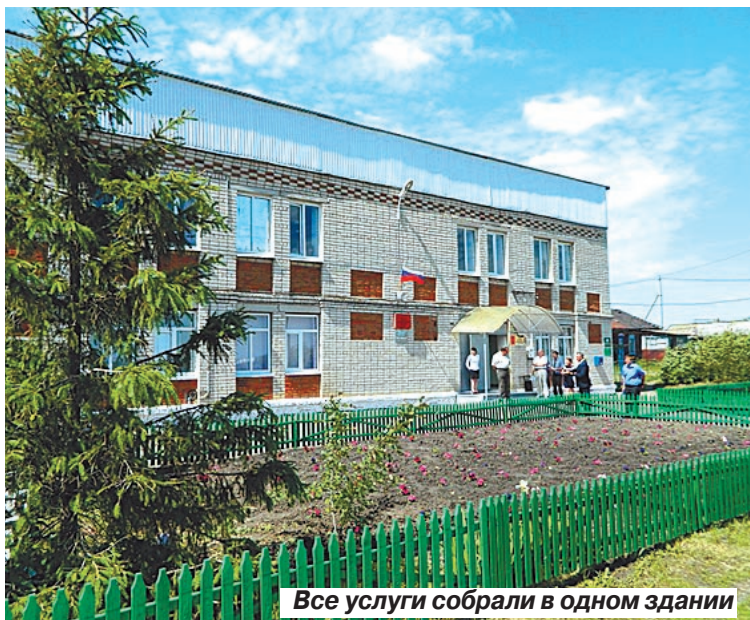
Все услуги собрали в одном здании