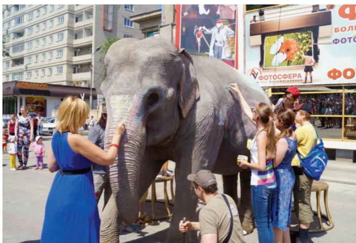
Хобот великанши дрессировщица недоверила никому

Пенсионерка циркового шоу Ранго перегрелась на жаре, пока дети разрисовывали ее шкуру