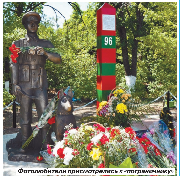
Фотолюбители присмотрелись к «пограничнику»