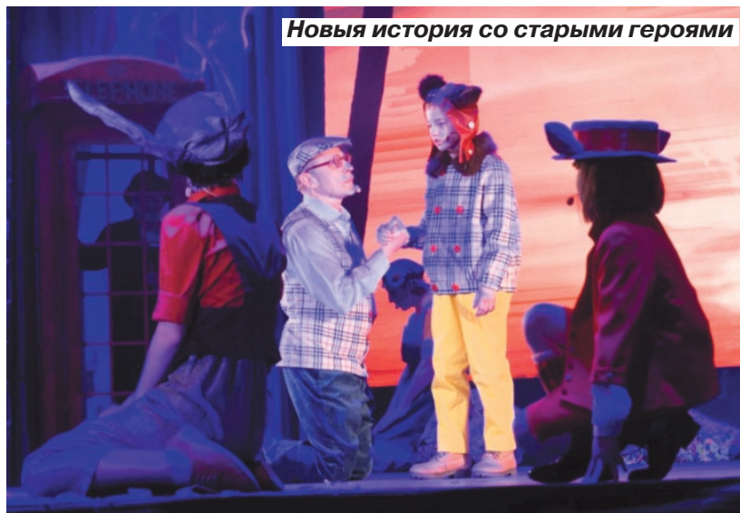
Новая история со старыми героями