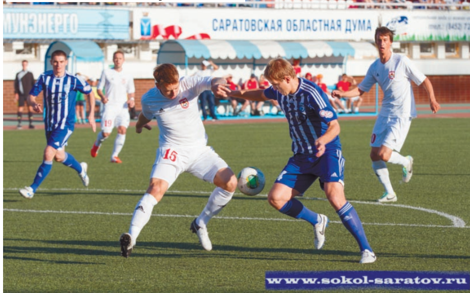
Фанаты гонят команду к победам

После финального свистка футболисты «Сокола» несколько раз выходили на поле поблагодарить своих поклонников за поддержку. Болельщики не справились с переполнявшими их чувствами и зажгли в прямом смысле этого слова. Восточную трибуну заволочило едким дымом. Кто-то из фанов взорвал дымовую шашку и воспламенил файеры. После этого полицейские стали выводить с «Локомотива» полураздетых молодых людей, которые, по мнению правоохрани-