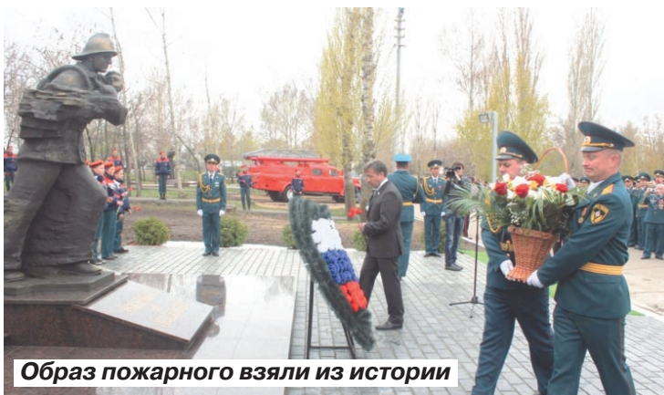
Образ пожарного взяли из истории

Для создания новых монументов скульптор использовал ультрасовременные материалы