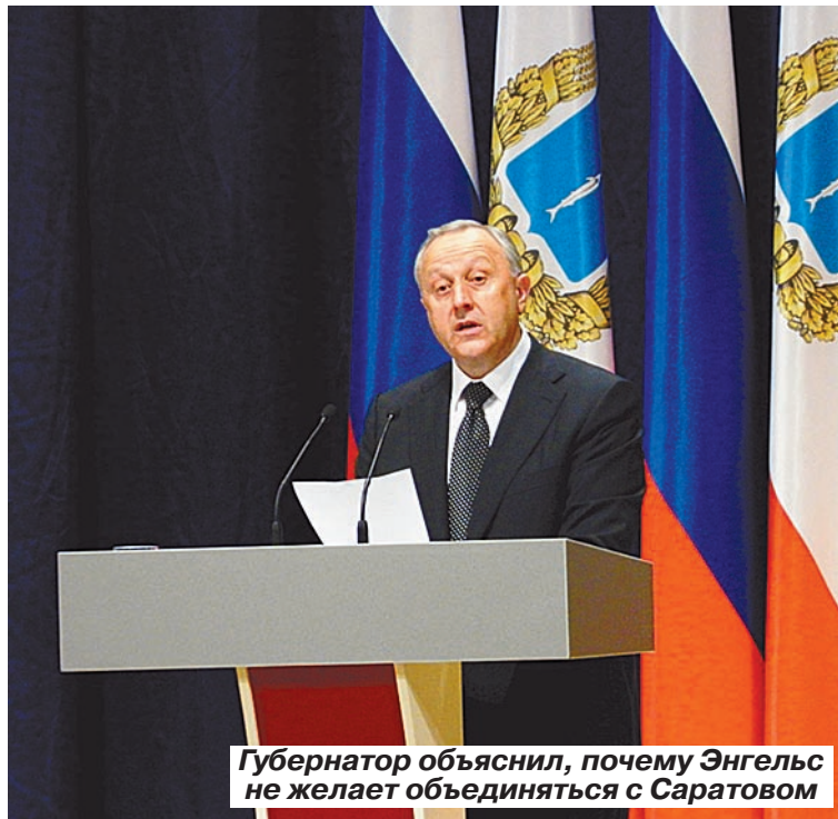
Губернатор объяснил, почему Энгельс не желает объединяться с Саратовом

– Почему? – задался губернатор вопросом и сам на него ответил: – А потому что каждый житель Энгельса патриот, а все вместе они осознают себя самостоятельной монолитной общностью, не желающей растворяться в агломерации. И в этом нет ничего удивительного, таков закон социума: когда ты существуешь в ритме города, когда вкладываешься в него, что-то реально делаешь для удобства жизни своей и своих соседей, твое отношение к этой территории становится иным. Поэтому ругая и критикуя те или иные недостатки