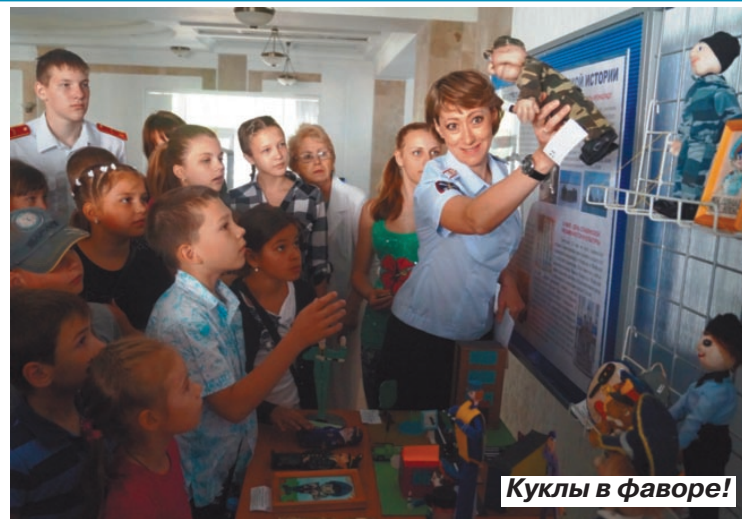
Куклы в фаворе!