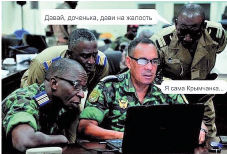
На самом деле мобильные молодежные интернет-комментаторы – это просто подтанцовка. Вот как выглядят штатные бойцы информационных войск, выдающие себя за простых россиян

Как из молодых саратовцев вербуют «пятью колонну»