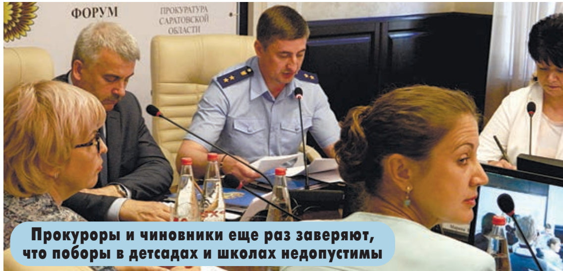
Прокуроры и чиновники еще раз заверяют, что поборы в детсадах и школах недопустимы

не все нарекания еще устранены. Так в столовых школ и детсадов выявляются продукты питания с истекшим сроком годности или вообще без каких-либо документов, также занижают вес блюд, детям недодают свежие овощи и фруктов, мяса, молочных продуктов. Под контролем работа школ по выявлению детей, попавших в сложную жизненную ситуацию. Проверки прокуратуры показывают, что воспитательные мероприятия в школах проводятся формально. Отсюда тот факт, что большинство детских преступлений совершают именно школьники.