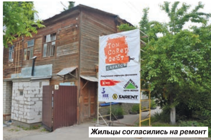
Жильцы согласились на ремонт

«Том Сойер Фест» – общественная инициатива, которая уже прошла успешную апробацию в ряде соседних регионов. Сама идея зародилась в Самаре в 2015 году. За два года в рамках проведения фестиваля