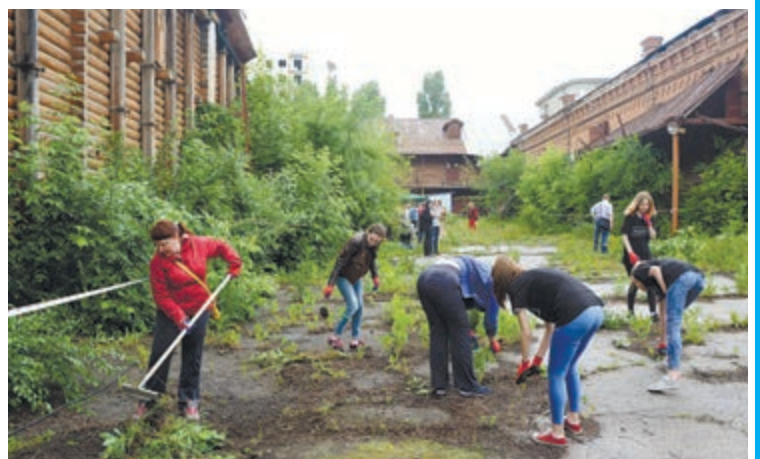
Склады должны открыться для искусства

роде уникальных творческих площадок для организации выставок и масштабных культурных мероприятий, предстоит проделать колоссальный объем работ. Да и скрывать, собственно, нечего – удручающее состояние, в котором пребывают разрушенные не только временные бывшие провиантские склады, говорит само за себя. Пока любопытную публику встречают лишь почерневшие и обведенные огнем балки и пустые глазницы окон, так что, лишь обладая очень сильным воображением, можно представить на их месте стены будущей галереи. Учитывая состояние объекта и принимая в расчет необходимость его бережной реставрации – которая, к слову сказать, будет проходить поэтапно – едва ли можно надеяться, что в конце августа, как и было обещано, центр распахнет двери перед первыми посетителями во всей своей мощи и красе. Зато есть шанс, что еще до официального открытия культурной площадки, на обширной и удобной по своему местоположению территории будут устраиваться различные творческие акции – перформансы, презентации, лекции и встречи. Правда, подробности этих акций организаторы пока держат в тайне, обещая оперативно оповещать о них всех заинтересован-