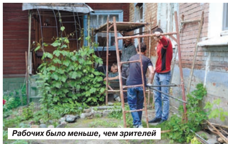
Рабочих было меньше, чем зрителей

Дипломы об окончании необычного вуза, наконец, получили саратовские пенсионеры. В конце прошлого года для 530 пенсионеров региона началась студенческая жизнь – они стали слушателями «Он-лайн Университета третьего возраста». И теперь приехали в Саратов на фестиваль выпускников, который состоялся в прошедшую пятницу в филармонии имени А. Шнитке.