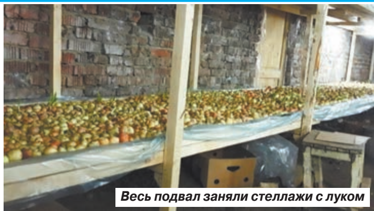
Весь подвал заняли стеллажи с луком

Елена ГОРШКОВА, фото с официального сайта картины