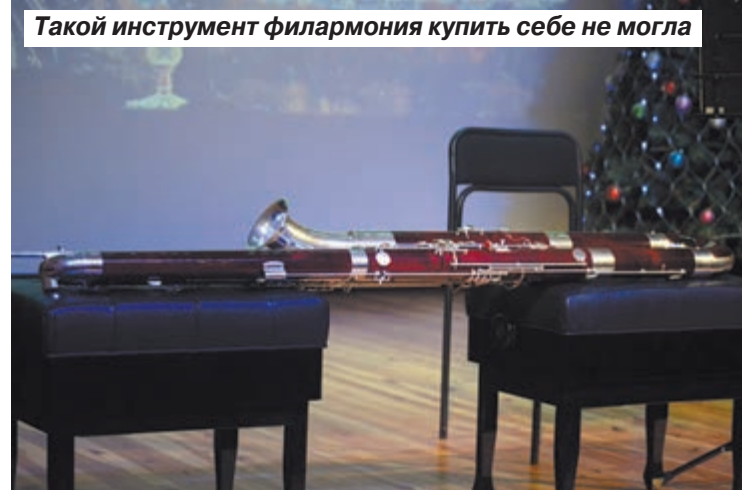
Такой инструмент филармония купить себе не могла

На самом деле, руководству саратовской филармонии не впервой принимать ценные подарки от меценатов. Самый