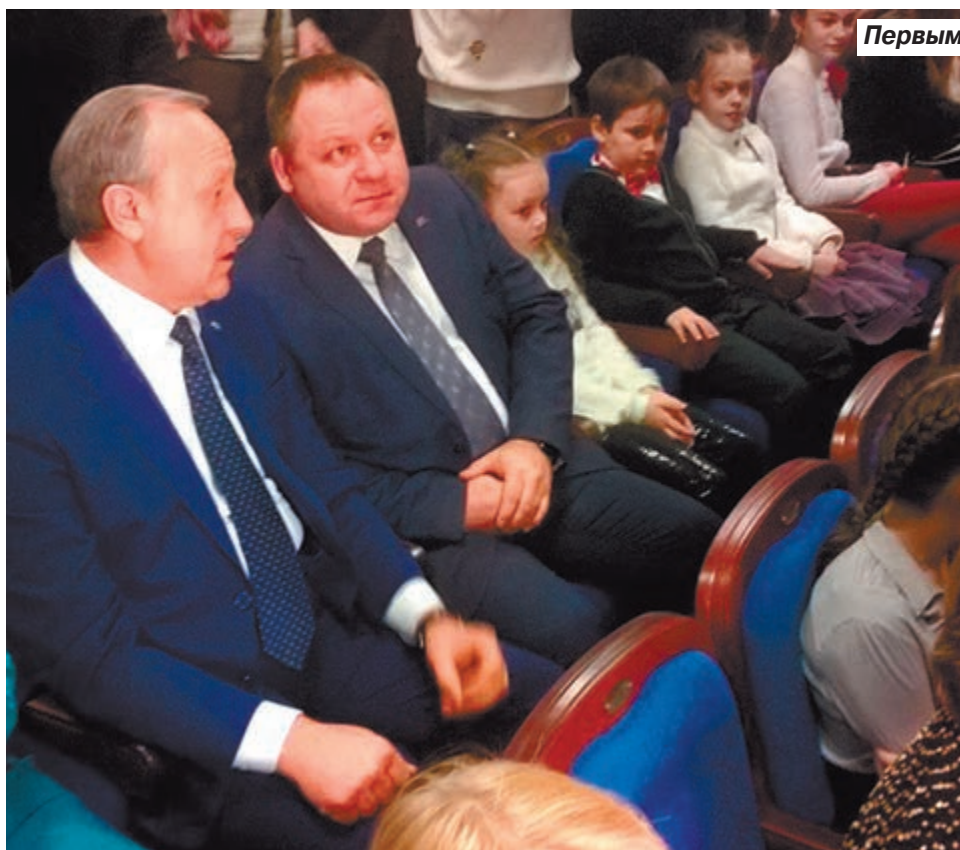
Первыми гостями стали дети и многочисленные чиновники