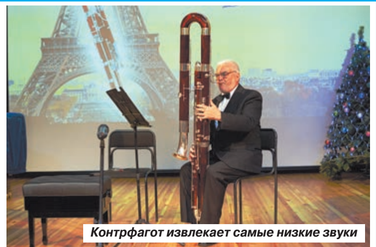
Контрфагот извлекает самые низкие звуки

первый дар учреждению культуры преподнес сам Мстислав Ростропович, передавший музыкантам английский рожок.