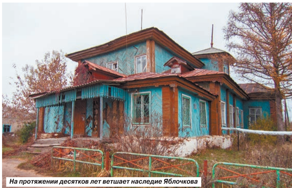
На протяжении десятков лет ветшает наследие Яблочкова