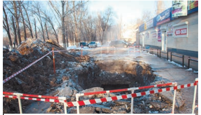
На фото от администрации активной деятельности не заметно

Валерий Радаев потребовал от ответственных чиновников правительства перейти на круглосуточный режим работы.