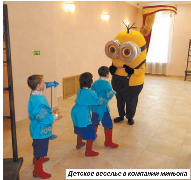
Детское веселье в компании миньона