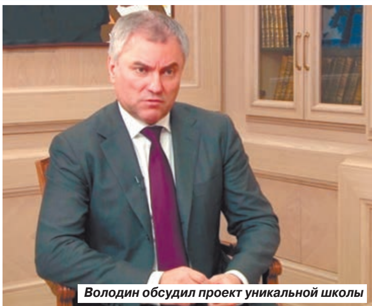
Володин обсудил проект уникальной школы

После Нового года в Саратове начнется строительство нового и совершенно уникального образовательного учреждения. При Саратовском государственном университете имени Н.Г. Чернышевского появится предвуниверсарий, где будут получать научные знания самые талантливые и одаренные дети со всего региона. Это становится возможным благодаря нашему земляку, председателю Государственной Думы РФ Вячеславу Володину.