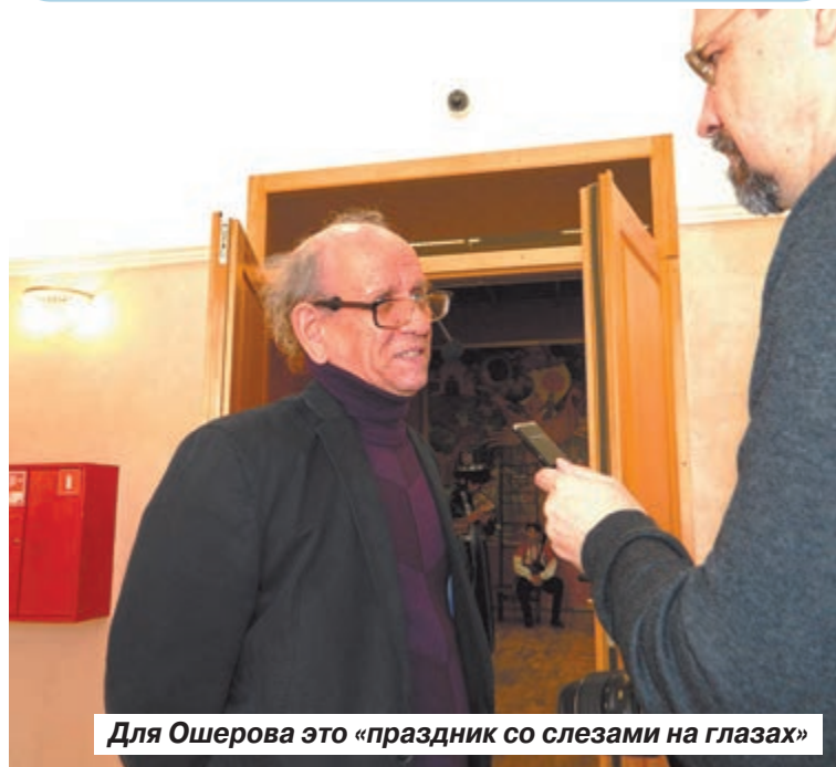
Для Ошера это «праздник со слезами на глазах»

Саратовцам представили, во что за четыре года после пожара превратился исторический ТЮЗ