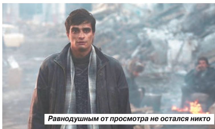
Равнодушным от просмотра не остался никто

– Разрушения в Ленинскане реконструировали на одной из