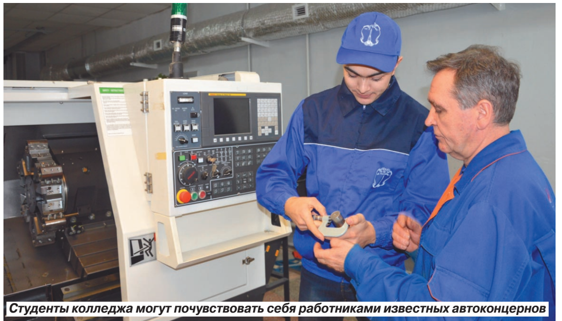
Студенты колледжа могут почувствовать себя работниками известных автоконцернов

«Металлист» оснащен симуляционными моделями, особыми станочными тренажерами с программным обеспечением фирм «Siemens» и «Fanuc». Из-за дороговизны такие станки не могут себе позволить даже многие крупные промышленные предприятия.