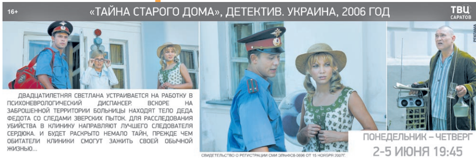
«ТАЙНА СТАРОГО ДОМА», ДЕТЕКТИВ. УКРАИНА, 2006 ГОД ДВАДЦАТИЛЕТНЯЯ СВЕТЛАНА УСТРАИВАЕТСЯ НА РАБОТУ В ПСИХОНЕВРОЛОГИЧЕСКИЙ ДИСПАНСЕР. ВСКОРЕ НА ЗАБРОШЕННОЙ ТЕРРИТОРИИ БОЛЬНИЦЫ НАХОДЯТ ТЕЛО ДЕДА ФЕДОТА СО СЛЕДАМИ ЗВЕРСКИХ ПЫТОК. ДЛЯ РАССЛЕДОВАНИЯ УБИЙСТВА СО СЛЕДАМИ НАПРАВЛЯЮТ ЛУЧШЕГО СЛЕДОВАТЕЛЯ СЕРДЦА, И БУДЕТ РАСКРЫТО НЕМАЛО ТАИН, ПРЕНДЕ ЧЕМ ОБИТАТЕЛИ КЛИНИКИ СМОГУТ ЗАЖИТЬ СВОЕЙ ОБЫЧНОЙ ЖИЗНЬЮ... ПОНЕДЕЛЬНИК – ЧЕТВЕРГ 2-5 ИЮНЯ 19:45

НА 2-Е ПОЛУГОДИЕ 2014 Г. ПО СНИЖЕННОЙ ЦЕНЕ ТОЛЬКО С 15 ПО 30 МАЯ 2014 Г. ПОДПИСНОЙ ИНДЕКС В1621