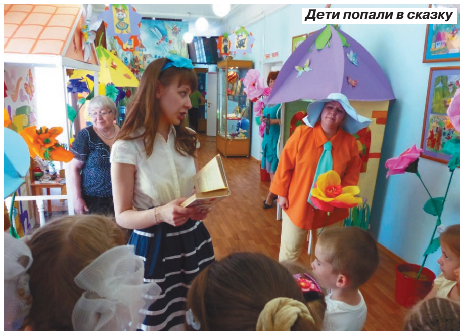
Дети попали в сказку

В музее Федина к юбилею любимой детской повести построили сказочный городок