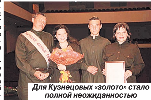
Для Кузнецовых «золото» стало полной неожиданностью