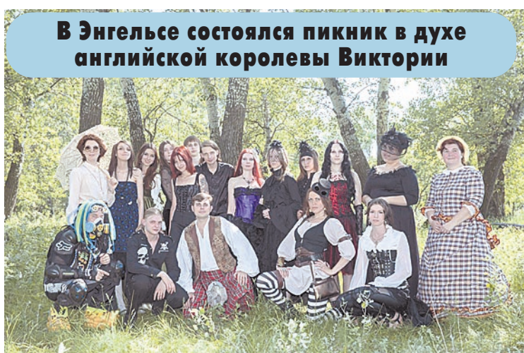
В Энгельсе состоялся пикник в духе английской королевы Виктории