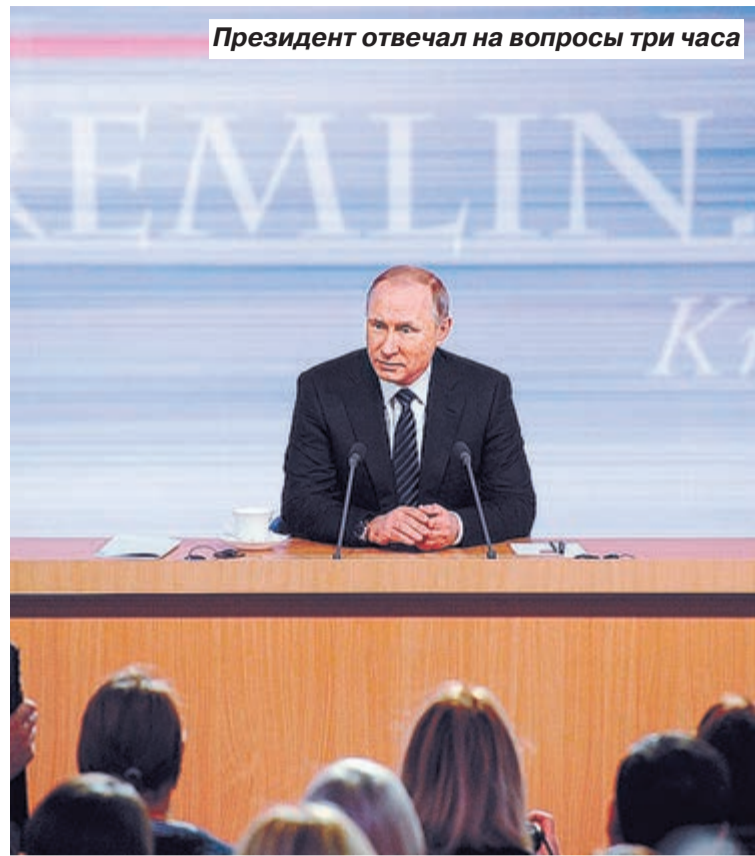
Президент отвечал на вопросы три часа

Необходимо заниматься, я уже об этом говорил в Послании, им-