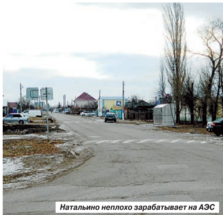
Натальино неплохо зарабатывает на АЭС

ных пунктов в нашем регионе насчитывается 88 вымерших деревень и сел. От них остались только названия, а численность жителей составляет ноль человек. По данным же Всероссийской переписи населения 2010 года в регионе было 95 мертвых сел. Нет, никто в них не заселялся. Просто власти успели ликвидировать некоторые населенные пункты и стереть их названия с карт.