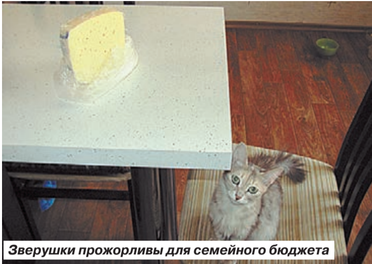
Зверушки прожорливы для семейного бюджета

отражают реальные расходы на домашних животных в нашей стране, так как аналитики проводили исследование в столице, где уровень жизни колоссально отличается от провинции. Столь существенная разница в затратах на питомцев в России и за рубежом объясняется тем, что у нас примерно половина владельцев предпочитают потчевать свою живность не рекомендованными ветеринарами кормами, а обычной едой, зачастую, попросту объедками с хозяйского стола.