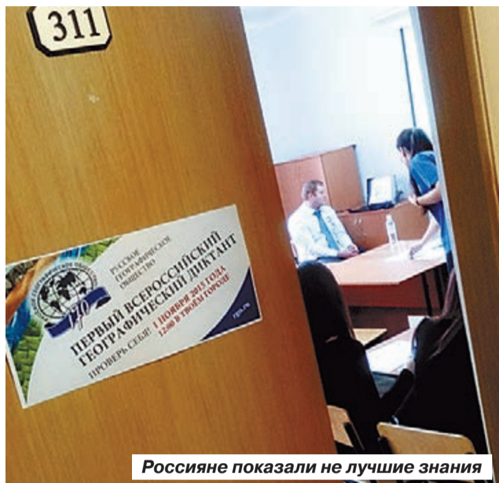
Россияне показали не лучшие знания

Русское географическое общество публикует результаты проведенного в прошлом месяце Всероссийского географического диктанта. Да, так много времени потребовалось специалистам, чтобы проанализировать все сданные работы. Диктант прошел во всех регионах страны, в нем приняли участие порядка 72 тысяч человек. Из них около 600 человек отвечали на вопросы в стенах Саратовского государственного университета. Однако результаты образовательной акции не обрадовали. Об этом обещают доложить самому Владимиру Путину. Какие знания по географии родной страны показали россияне, выяснил «ТелеграфЪ».