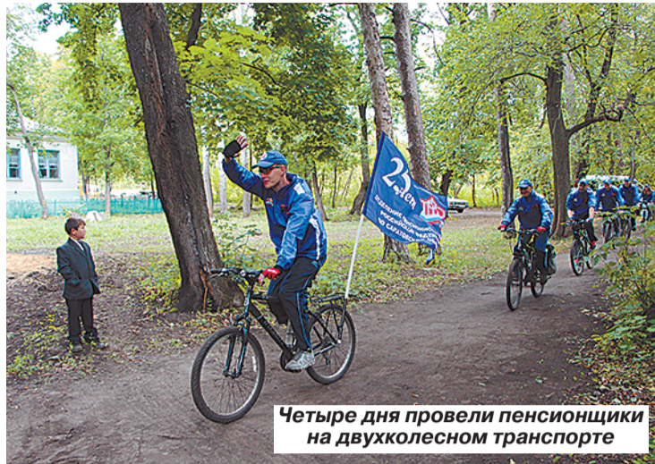
Четыре дня провели пенсионщики на двухколесном транспорте

Сотрудники отделения Пенсионного фонда по Саратовской области постоянно примеряют на себя новые ампулы. Они прекрасно справляются не только со сложными расчетами, но и отлично поют, танцуют, вышивают, рисуют, да еще и идут на спортивные рекорды. Шутка ли, проехать четыре дня на велосипеде! А пенсионщикам любое дело по плечу. Тем более что данное мероприятие было организовано в рамках федерального проекта «Старшее поколение» и приурочено сразу к двум круглым датам: 70-летию Победы в Великой Отечественной войне и 25-летию образования Пенсионного фонда России. Поэтому к веломарафону подошли весьма ответственно.