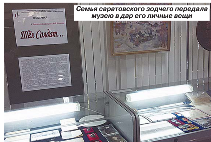
Семья саратовского зодчего передала музею в дар его личные вещи