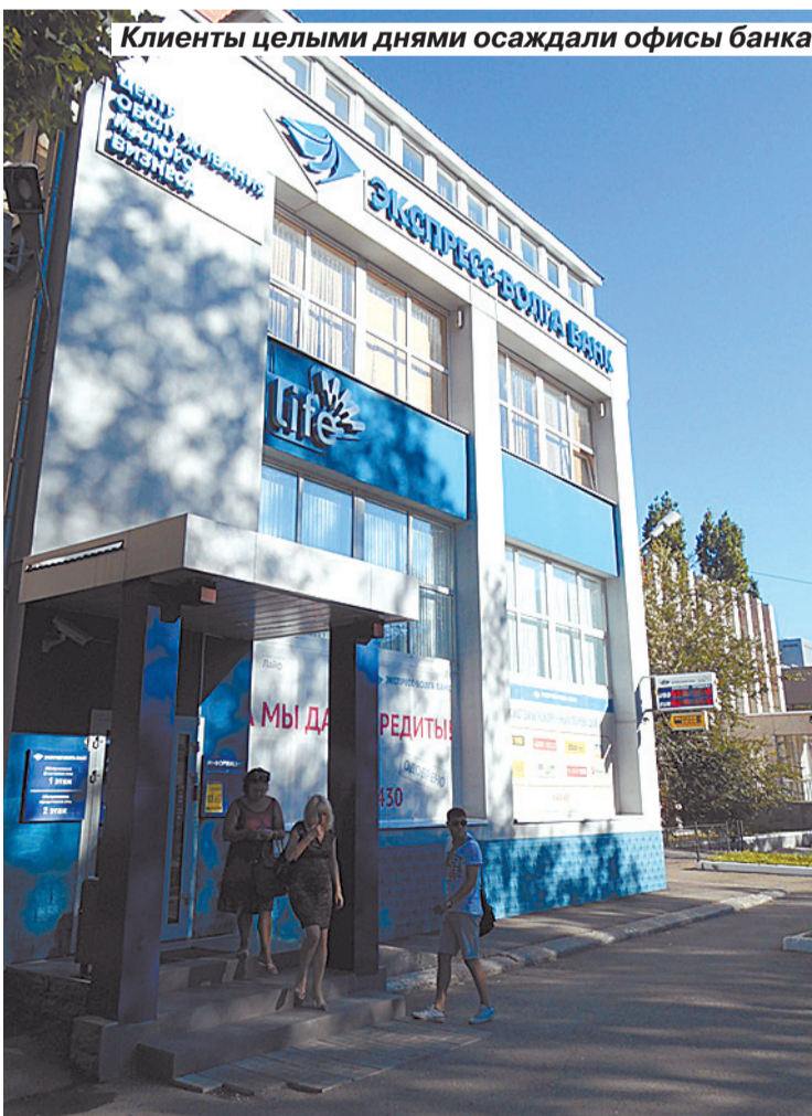
Клиенты целыми днями осаждали офисы банка