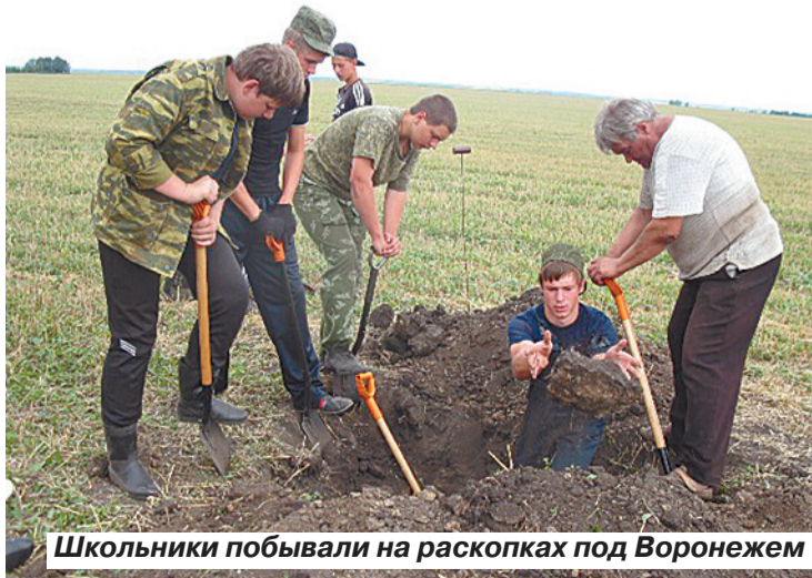
Школьники побывали на раскопках под Воронежем

проводить время не возле котелка, а в бывших блиндажах или окопах. Во время раскопок