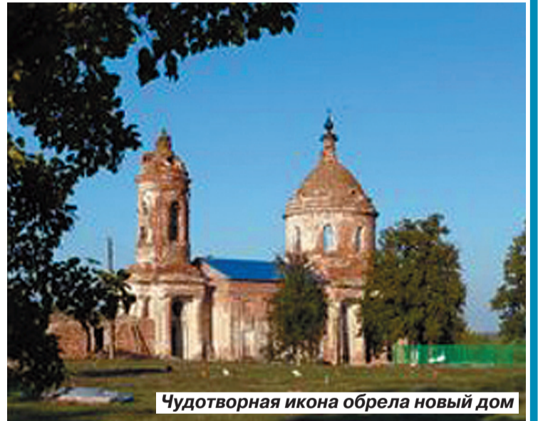
Чудотворная икона обрела новый дом