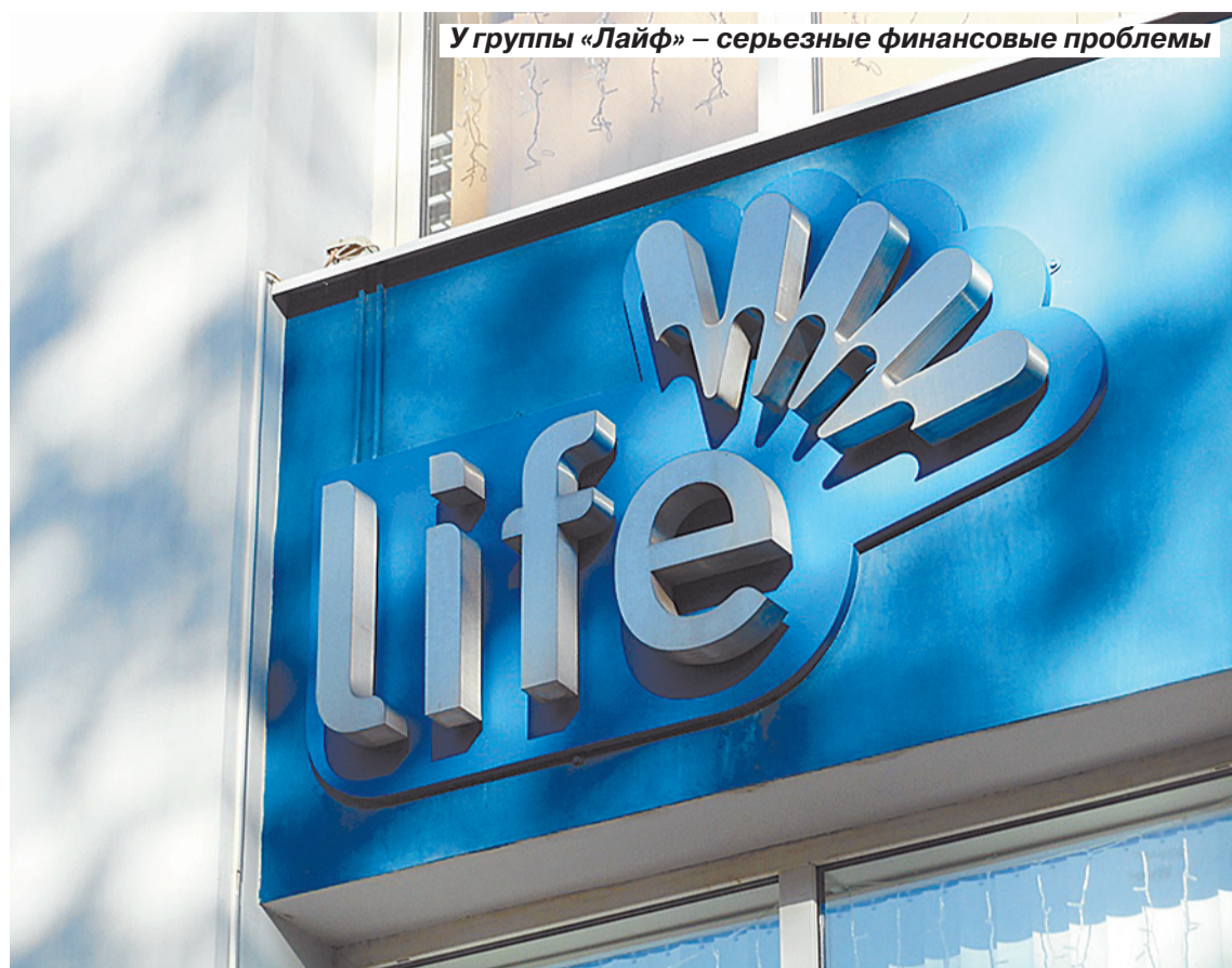
У группы «Лайф» – серьезные финансовые проблемы

– Сожалеем, но денег сейчас в наличии нет, поймите. Попробуйте прийти к нам позже, возможно, завтра, – такой ответ звучал чаще всего.