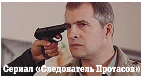
Сериал «Следователь Протасов»

06.00, 10.00, 12.00, 15.30, 18.30, 22.00 Сейчас 06.10 Утро на «5» (6+) 09.30 Место происшествия 10.30, 11.25, 12.30, 12.50, 13.40, 14.35, 15.25, 16.00, 16.45, 17.40 Т/с «Кулинар» (16+) 19.00, 19.40, 01.40, 02.25, 03.05, 03.40, 04.10, 04.45, 05.15 Т/с «Детективы» (16+) 20.20, 21.10, 22.25 Т/с «След» (16+) 23.15 Момент истины (16+) 00.10 Место происшествия. О главном (16+) 01.10 День ангела (0+)