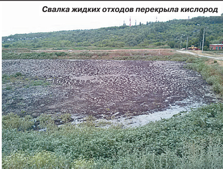
Свалка жидких отходов перекрыла кислород

— Он то появляется, то вновь исчезает, — рассказывает Светлана Аксенова, жительница до-