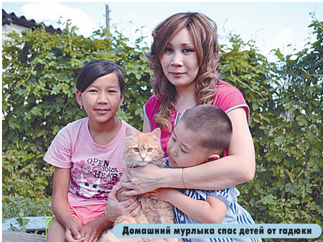
Домашний мурлыка спас детей от гадюки