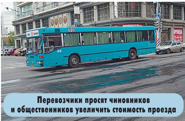
Перевозчики просят чиновников и общественников увеличить стоимость проезда

валют, транспортные предприятия очень сильно просели в финансовом плане. Если тариф останется на том же уровне, это очень быстро приведет к тому положению, которое мы наблюдали в конце 90-х годов прошлого века.