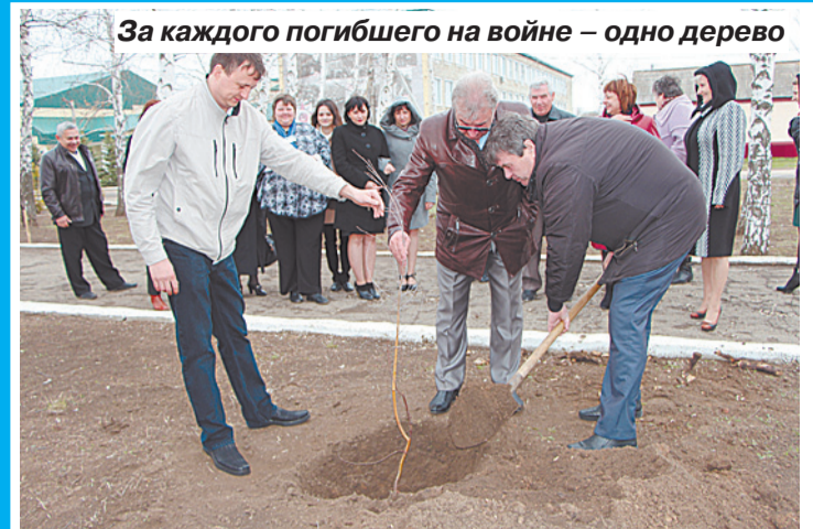
За каждого погибшего на войне – одно дерево