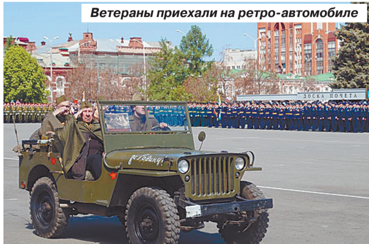
Ветераны приехали на ретро-автомобиле