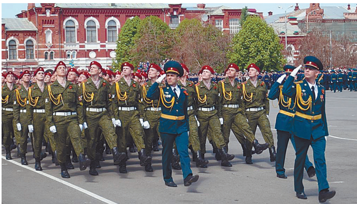
После долгого перерыва на Театральной площади в честь Дня Победы чеканили шаг саратовские военные

Проведение парадов Победы в этом году строго регламентировано законодательством. Непосредственно 9 мая, согласно распоряжению президента России, войска прошли только