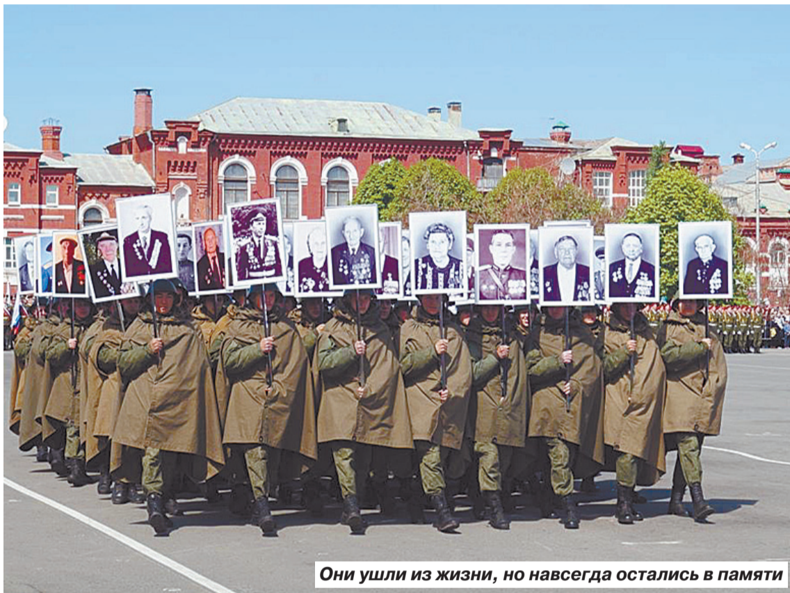
Они ушли из жизни, но навсегда остались в памяти