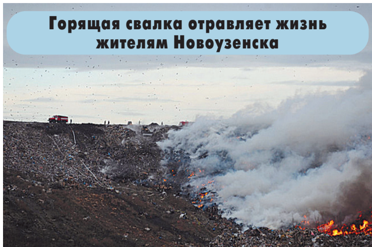
Горящая свалка отравляет жизнь жителям Новоузенска