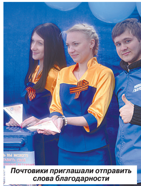
Почтовики приглашали отправить слова благодарности