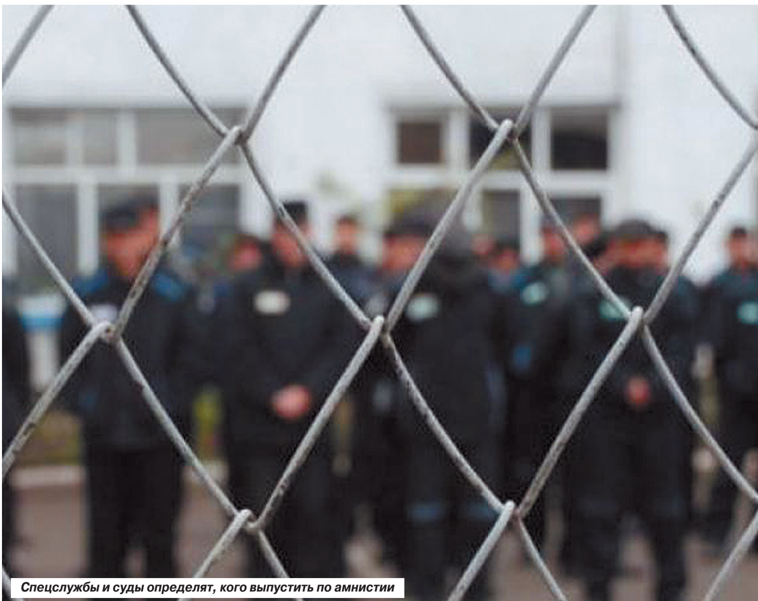
Спецслужбы и суды определяют, кого выпустить по амнистии