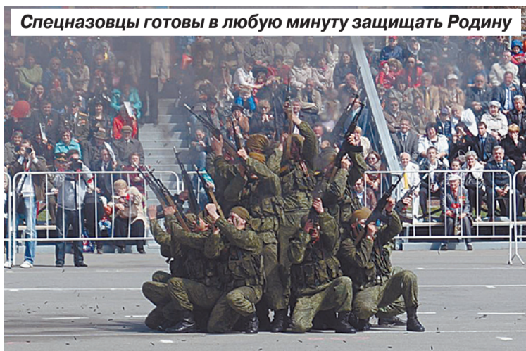
Спецназовцы готовы в любую минуту защищать Родину