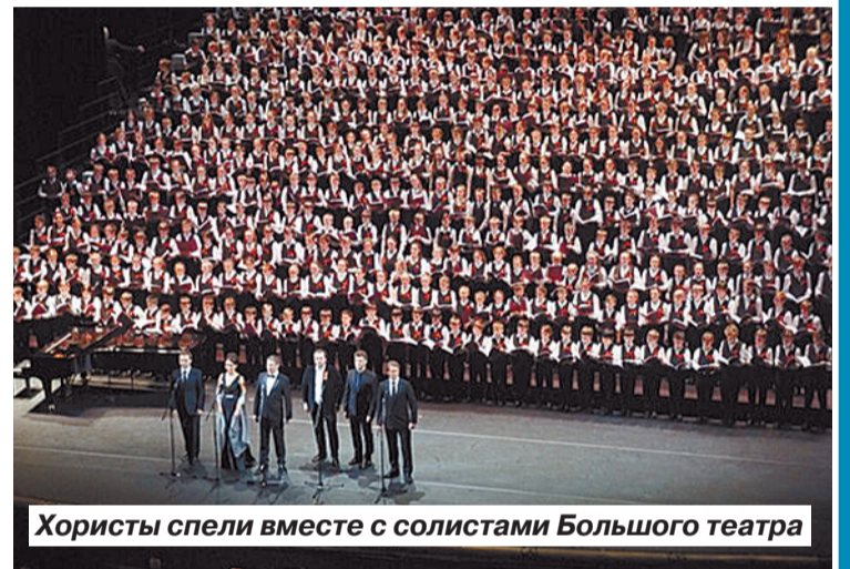
Хористы спели вместе с солистами Большого театра

Елена ГОРШКОВА