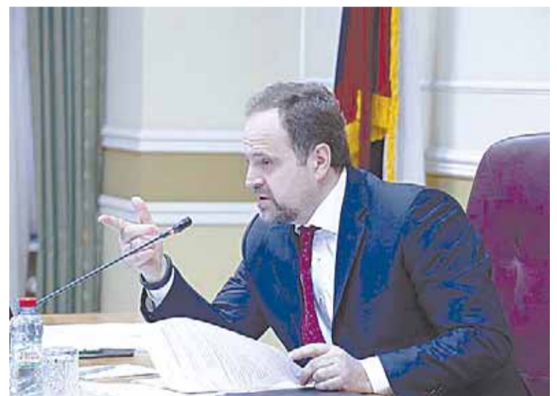
Министр Донской поручил контролировать уровень воды в реках

– У нас пока нет информации о возможном маловодье на Волге, – заверяет он. – Поймите, даже если бы на всей территории Саратовской области стоял снег в один метр, то это никак не повлияло бы на полноводность водохранилища – 98-99% всей во-