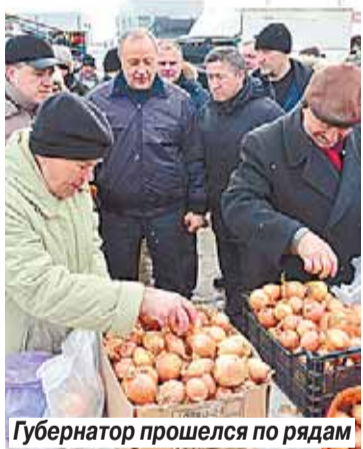
Губернатор прошелся по рядам

Роман ВОРОНЕЖСКИЙ , фото пресс-службы губернатора