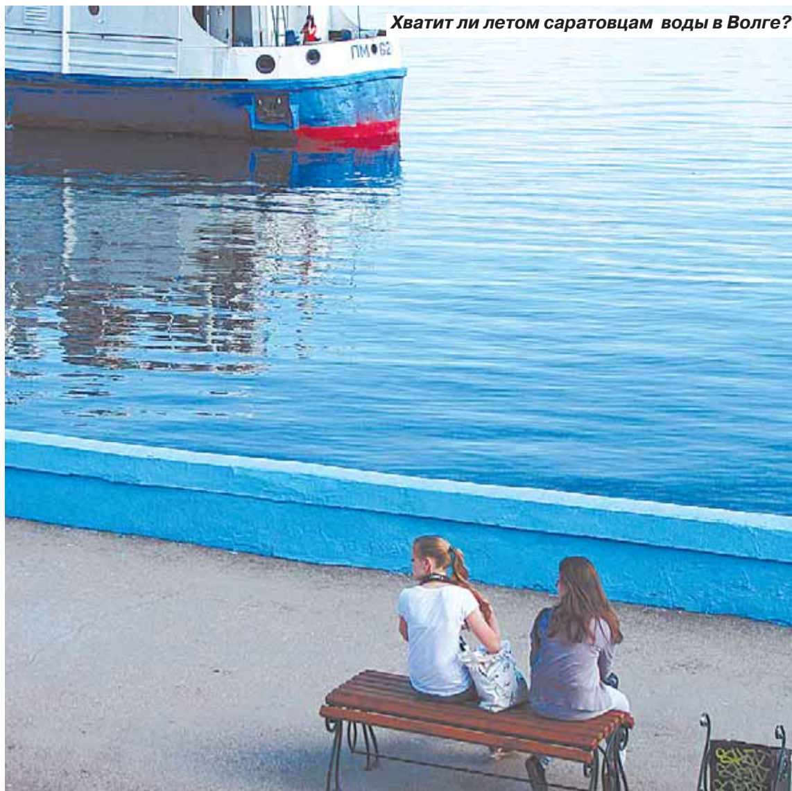
Хватит ли летом саратовцам воды в Волге?

Министр поручил принять все необходимые меры для устойчивого водообеспечения населения и объектов экономики в бассейне реки Волги в условиях низких запасов воды. Он