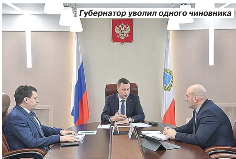
Губернатор уволил одного чиновника

– За предыдущие два года, учитывая, что каждый год мы дополнительно находили ресурсы, очередь уменьшилась. Но если только не прилагать дополнительные усилия и не подключать дополнительные возможности для решения этого вопроса, у нас очередь опять увеличится, потому что ежегодно на очередь встает около 400 детей, – отметил Володин. – На 1 января 2026 года, возмож-