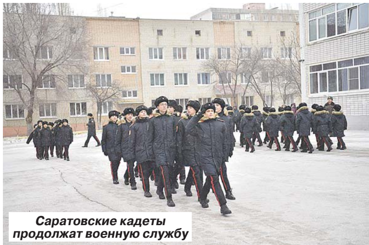
Саратовские кадеты продолжают военную службу

Ребята поделились своими планами на будущее – почти все они хотят связать свою судьбу с армией и пойти учиться в военные училища.