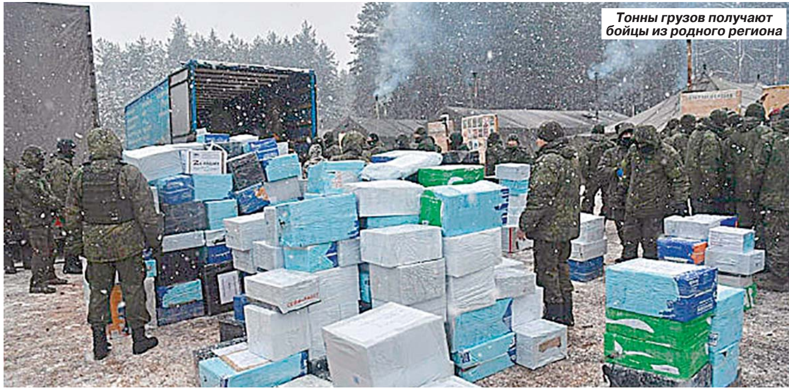
Тонны грузов получают бойцы из родного региона

– Хочу передать привет городу Саратову, всем своим родственникам, дорогим и любимым, своим друзьям, семье Каткуаевых. Все будет хорошо, служу хорошо, в отпуск не хочу. Слава ВДВ! – обратился один из бойцов.