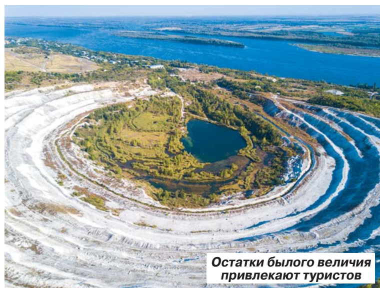
Остатки бывшего величия привлекают туристов

Так, в конце прошлого года школьникам поселка Дубки выпала возможность побывать в цехах крупнейшего в России комбината «Дубки». В рамках профориентационной экскурсии специалисты комбината постарались показать всю цепочку производства колбасной продукции. Учащиеся 10-го класса побывали во многих цехах: увидели весь процесс, начиная с производства фарша и заканчивая упаковкой. Интерес-