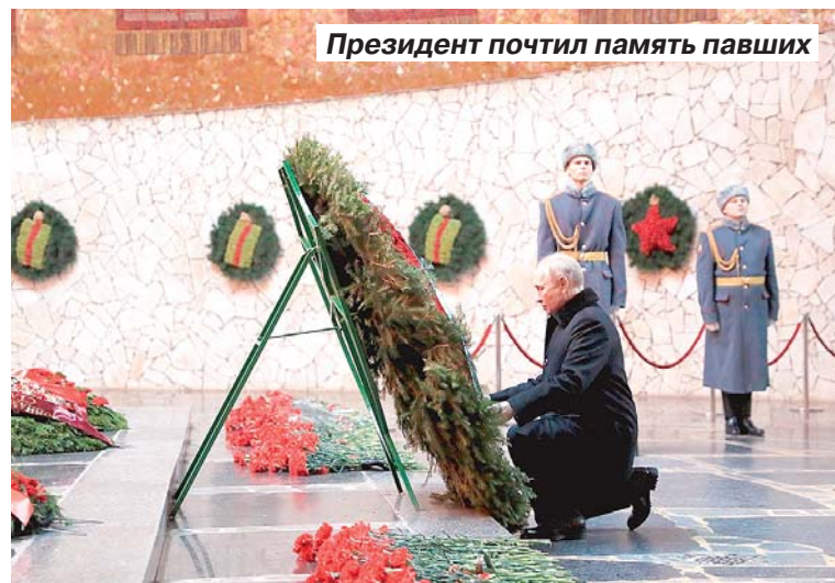
Президент почтил память павших

Для защиты Родины саратовские школьники готовы взять в руки автоматы и винтовки