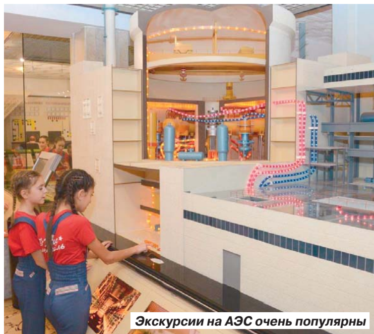
Экскурсии на АЭС очень популярны

Есть ли шанс полюбоваться работой крупнейших саратовских предприятий?