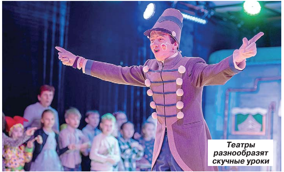
Театры разнообразят скучные уроки

ПО ГОРИЗОНТАЛИ: Собаководство. Маяк. Шарпей. Ярус. Ника. Увалень. Канал. Адлер. Вязь. Ласа. Тиски. Потап. Выюк. Носки. Риччи. Упрямец. Киану. Кета. Санд. Оноре. Морж. Див. Джинн. Авиасвязь. Яга. ПО ВЕРТИКАЛИ: Ушанка. Портмоне. Батрак. Течь. Акела. Камея. Арапник. Айран. Выя. Аванс. Асимов. Косуля. Куна. Типун. Альт. Дождь. Ивняк. Ересь. Мелодия. Кювет. Ринг. Рейкьявик. Царевна.