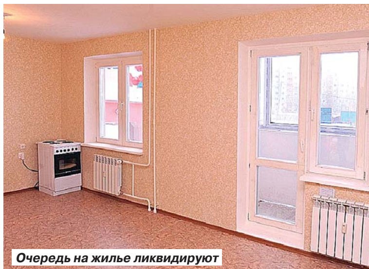
Очередь на жилье ликвидируют

Роман ВОРОНЕЖСКИЙ