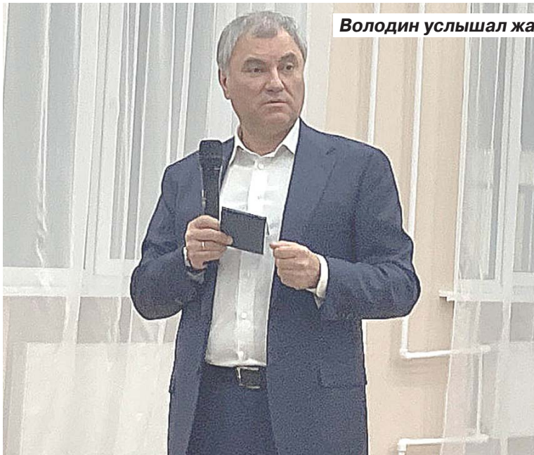
Володин услышал жалобы детей-сирот