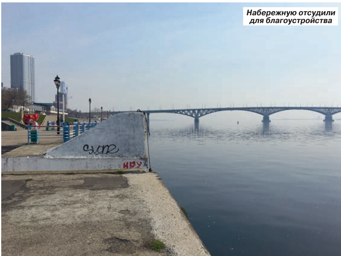
Набережную отсудили для благоустройства

Прокуратура не стала дожидаться самого плохого исхода и подала иск в суд. Надзорный орган аргументировал тем, что «из-за незаконных сделок, которые заключила саратовская администрация, право собственности на объект и землю под ним оказалось у физических лиц», при этом данный объект культурного наследия может находиться исключительно в федеральной собственности. Суд удовлетворил эти требования.