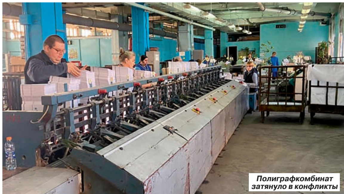
Полиграфкомбинат затаенно в конфликты

Ремонт набережной Космонавтов на участке от памятника Гагарина до моста был запланирован на этот год. Но, как сперва вы-