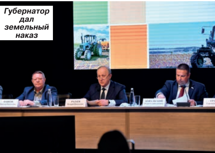
Губернатор дал земельный наказ

В новом аграрном сезоне засеют почти половину площади Саратовской области