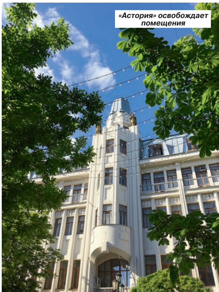
«Астория» освобождает помещения

Кроме того, прокуратура намерена отсудить у «Саратовского речного транспортного предприятия» в пользу государства другие береговые сооружения на Волге: причал в грузовом порту в поселке Юриш, а также пристани в Хвалынске и Ровном. Прокуратура считает, что государственные объекты недвижимости – гидротехнические сооружения – были незаконно переданы в аренду коммер-