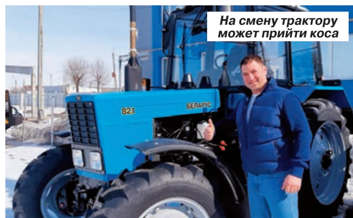
На смену трактору может прийти коса

молоко будут всегда востребованы, особенно в нынешней сложной ситуации, когда нам надо будет страну кормить.