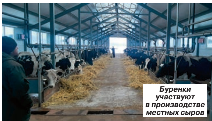
Буренки участвуют в производстве местных сыров