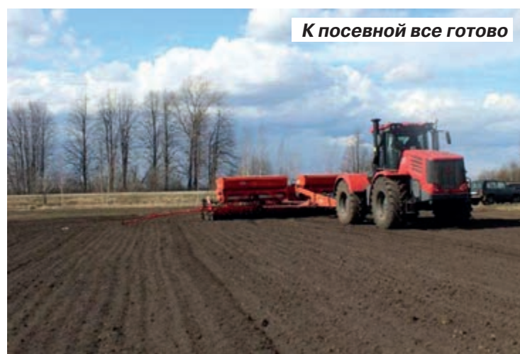
К посевной все готово

Аграрии Саратовской области получат существенную помощь от государства за свою работу. Например, только в рамках «компенсирующей» субсидии на проведение весенне-полевых ра-