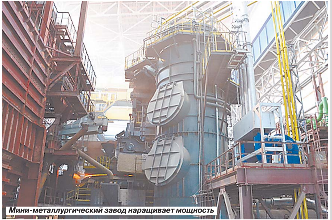
Мини-металлургический завод наращивает мощность