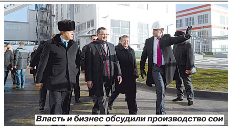
Власть и бизнес обсудили производство сои

В Саратовской области собрали лучший в Поволжье урожай – аграриям это настоящий повод для праздника. Бизнес и власть стараются, чтобы наши зерно, овощи и корма не уходили на экспорт для переработки и продажи в другие регионы и страны. Небывалый урожай саратовского подсолнечника способен переработать построенный холдингом «Солнечные продукты» новый маслоэкстракционный завод, который на прошлой неделе открылся в Балаковском районе. Это торжественное событие посетили губернатор Валерий Радаев и министр сельского хозяйства РФ Николай Федотов. Но у владельцев предприятия уже стоят еще более дальновидные планы. В присутствии почетных гостей здесь рядом заложили камень под строительство завода по переработке сои.