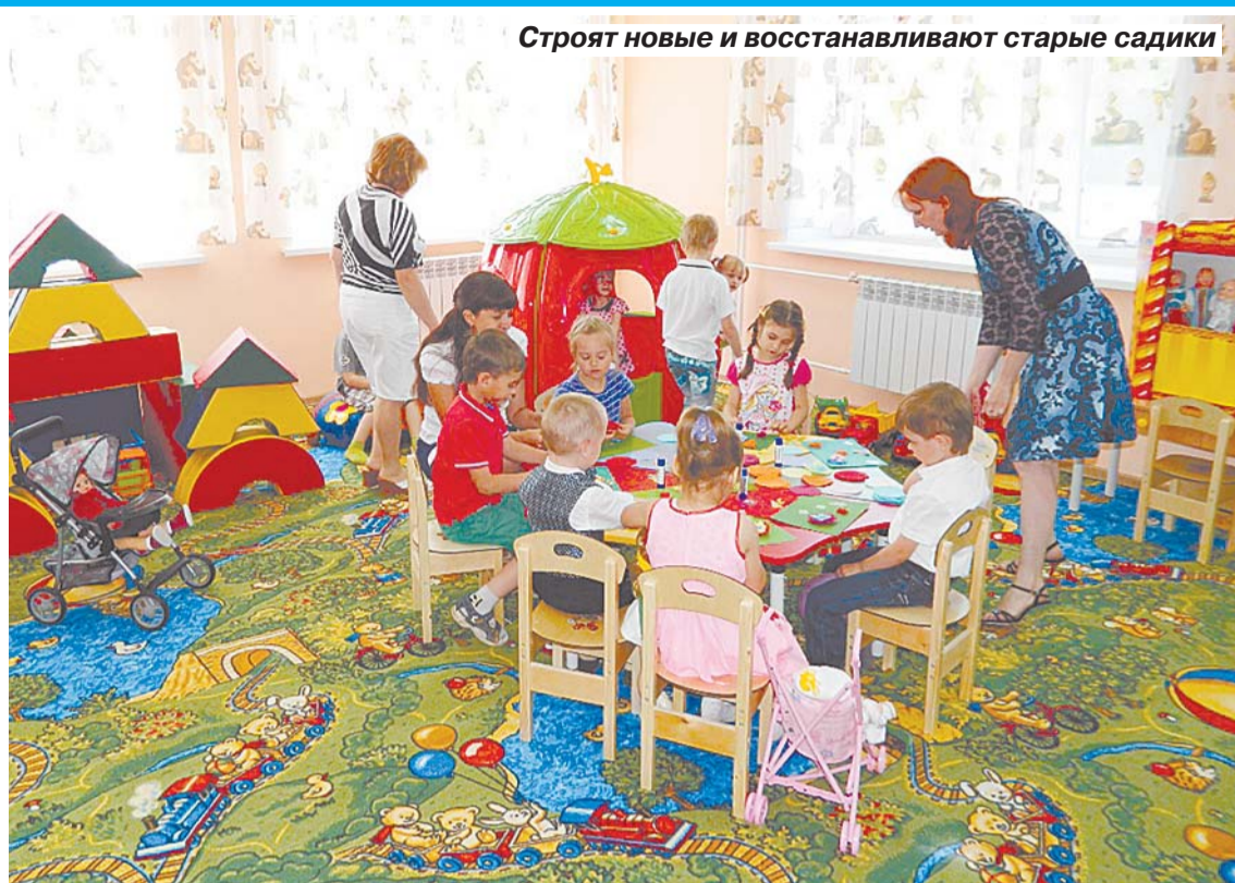
Строят новые и восстанавливают старые садики