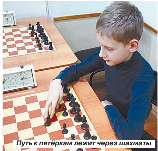
Путь к пятёркам лежит через шахматы