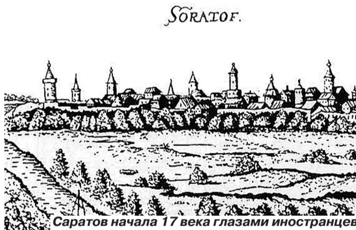
Саратов начала 17 века глазами иностранцев