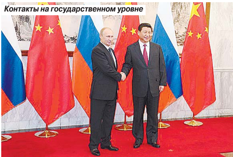
Контакты на государственном уровне

сотни миллиардов юаней. И это только одному университету на построение современного медицинского центра.