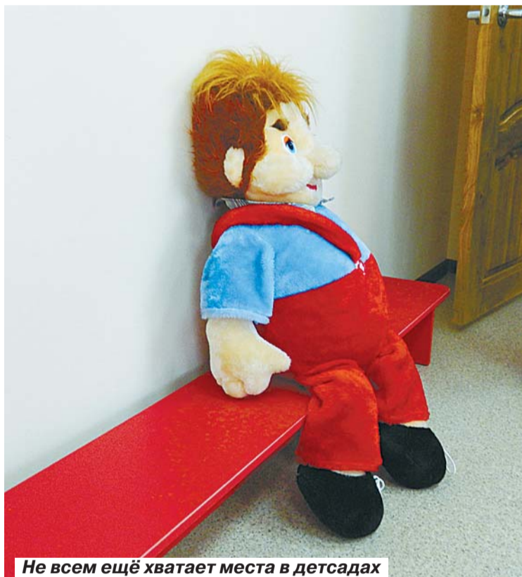
Не всем ещё хватает места в детсадах

вместного расположения детсада и школы стоит и в других районах, особенно там, где нет свободных территорий для строительства новых учреждений, но есть не используемые в учебном процессе школьные кабинеты.