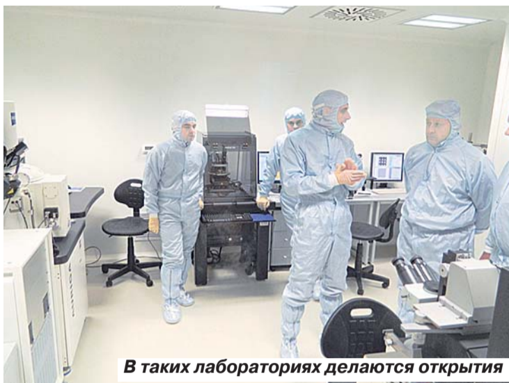
В таких лабораториях делаются открытия

С помощью микроскопа губернатор увидел, чем занимаются саратовские ученые