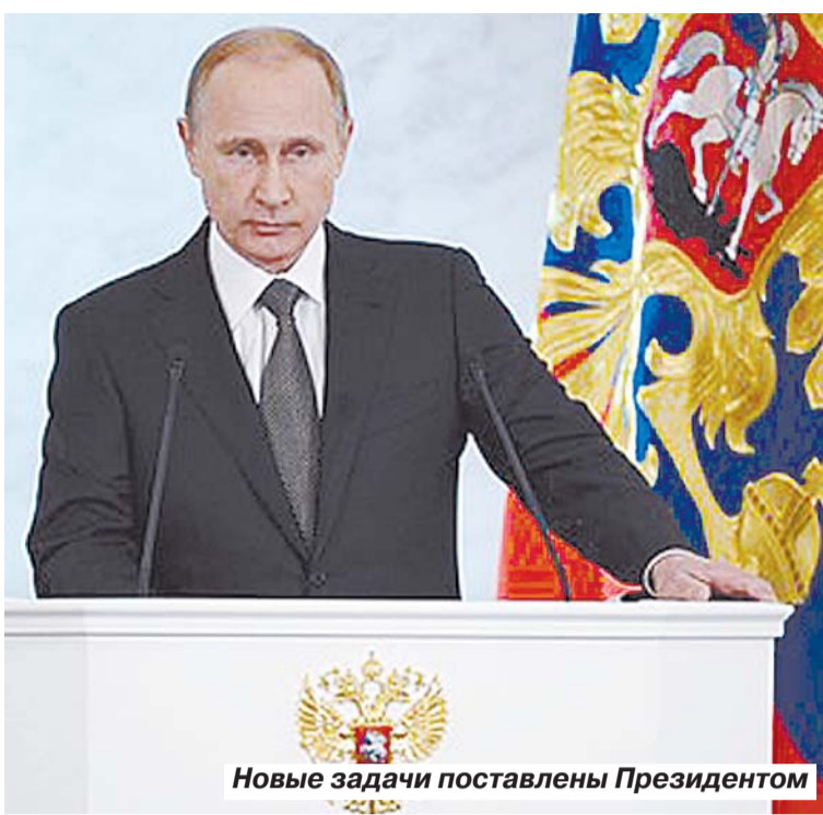
Новые задачи поставлены Президентом

На этом он призвал внимание западных коллег. – Мы не намерены втягиваться в дорогостоящую гонку вооружений, но при этом надёжно и гаран-