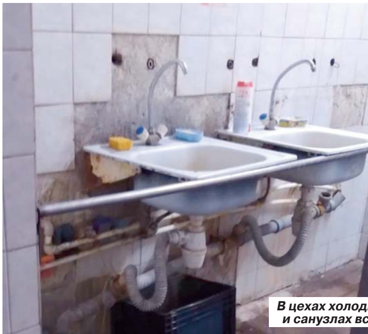
В цехах холодно, в душевых и санузлах всё обшарпано