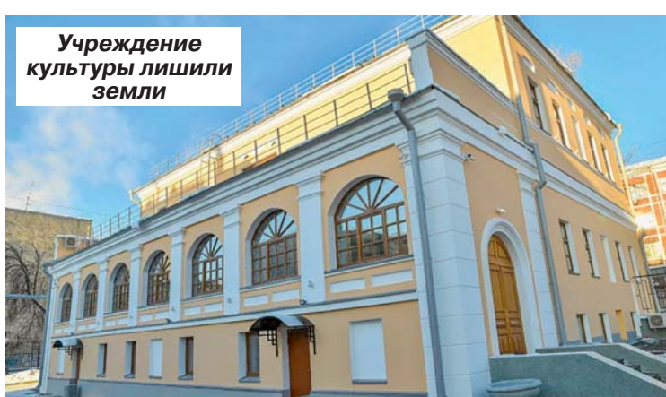
Учреждение культуры лишили земли

Во-вторых, строительство объекта торговли и общественного питания на землях, предназначенных для размещения музея, изначально было невозможно, как и раздел земельного участка в этих интересах. Видимо, поэтому в 2013 году предпри-