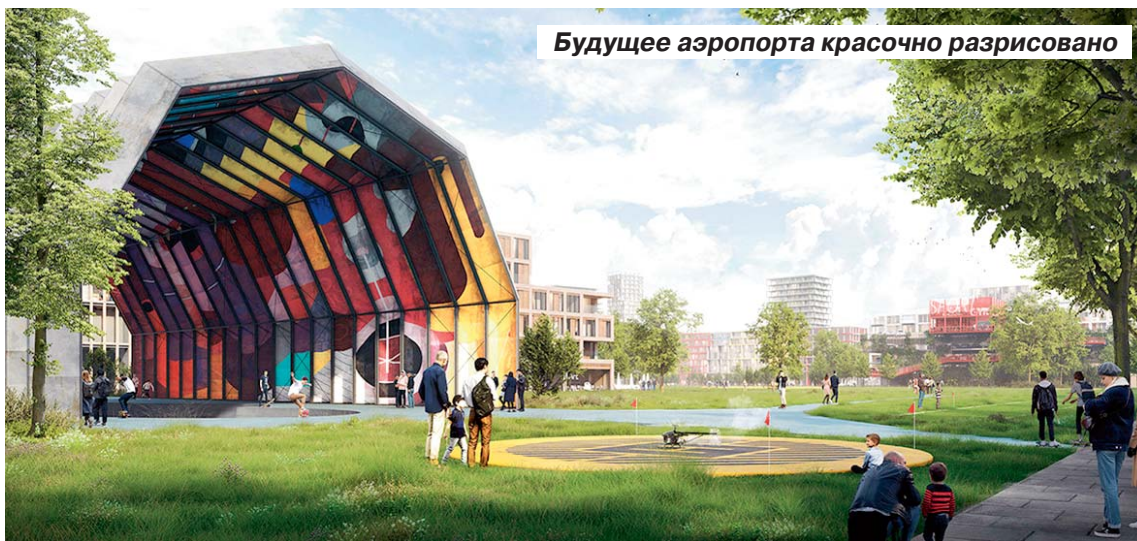
Будущее аэропорта красочно разрисовано

Они предложили мастер-план по преобразованию выведенного из эксплуатации аэродрома Саратов-Центральный в амбициозный новый центральный район города. Территория старого аэропорта при этом условно разбивается на четыре тематических района застройки. А взлетно-посадочные полосы становятся основными артериями общественного пространства, в том числе для транспорта и пешеходов.