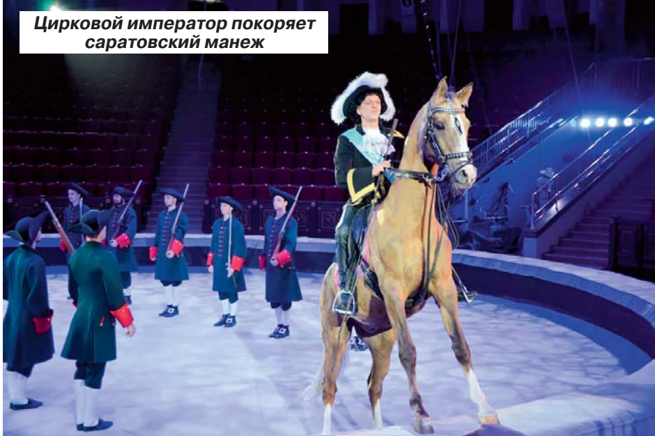
Цирковой император покоряет саратовский манеж

Ряженый Петр I знакомит саратовцев с секретами дрессуры лошадей