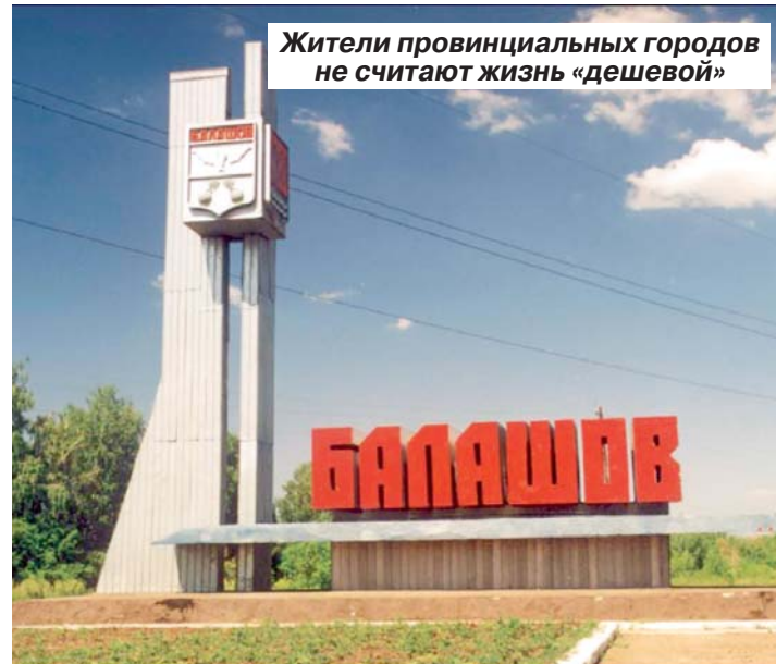
Жители провинциальных городов не считают жизнь «дешевой»

Балашовцы и ртищевцы не согласились с выводами Росстата