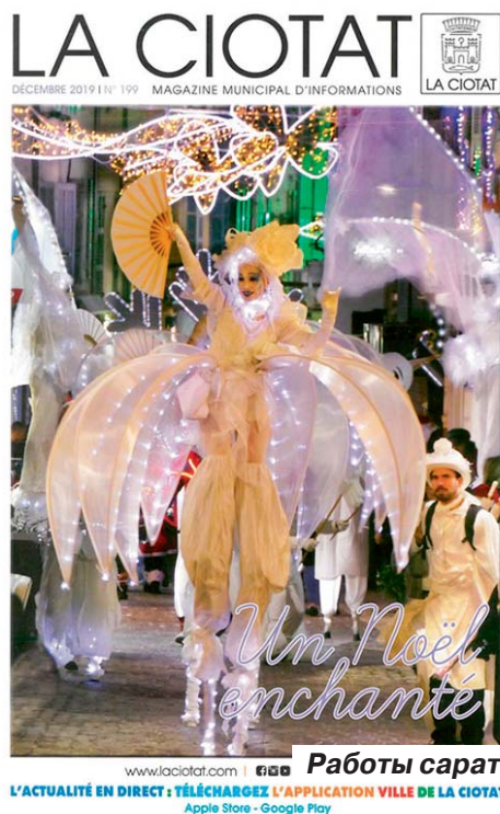
www.laciotat.com | Работы саратовских детей украсили французский журнал L'ACTUALITÉ EN DIRECT : TÉLÉCHARGEZ L'APPLICATION VILLE DE LA CIOTAT Apple Store - Google Play