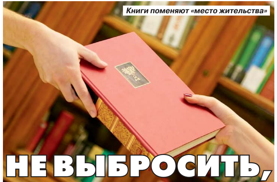
Книги поменяют «место жительства»

ПО ГОРИЗОНТАЛИ: МЕНЕДЖЕР – ТРУС – ОДР – ТРЕПАНГ – УР – ВИНТ – ВЬЮН – НЕ – ЕВРО – КОНКИСТАДОР – АР – УГОН – ИФ – ТАЙМ – ДРАГОМАН – ЕР – АИ – ШАРАДА – ДЖОН (ТРАВЛТА) – ОБОИ – НАОМИ – ОСАКА – ДАР – ПЕНС – КАСАТКИН. ПО ВЕРТИКАЛИ: ТОККАТА – ШИ – ЕРЕВАН – ПИ – КАМЕРДИНЕР – АННИ – РАЖ – ДАНТЕС – ДОВОД – ТУРМАН – МАК – ВЛАГА – «ВИРА» – РОЛЬ – ДОГ – «ОНО» – ОПА – ТРЕНЕР – МОРО – СЕТ – БЛАНК – РУКРАИНА – КСИ – СОР – ОРФ – ИРИНА.