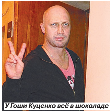
У Гоши Куценко всё в шоколаде

ВЕРТИКАЛЬ: Прицеп. Стикер. Бруно. Косолапый. Отгиб. Тройня. Пяльцы. Юго. Коли. Решимость. Кулинар. Сосуд. Изгиб. Аксон. Лясы. Пани. Гепард. Сольдо. Горе. Альча. Вес. Гир. Босс. Гренада. Брутто. Поток. Фурор. Скань. Апорт. Каток. Герб. Сом. Ключевое слово: ИНТУИЦИЯ.