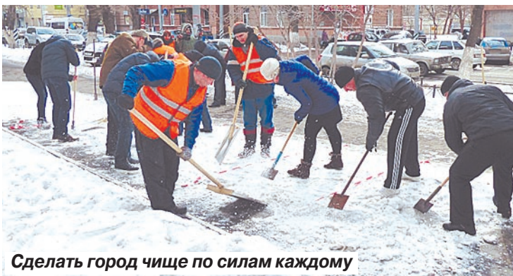
Сделать город чище по силам каждому

– Мы сосульки сбиваем с домов, лазаем по крышам, деревья пилим на высоте, дома штукатурим... Нелегко приходится, – рассказывает о своей работе веснушчатый парень среднего роста. – Зарплата у меня небольшая, а нагрузка высокая. А куда деваться – рабо-