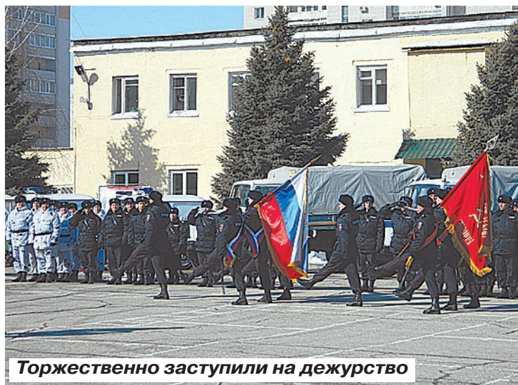
Торжественно заступили на дежурство

В штат этого батальона набрали, в основном, военнослужащих по контракту из Саратова и области. Служить во внутренних войсках – почетная миссия. Многие прошли ряд «горячих точек». А перед тем как попасть на службу в эту новую