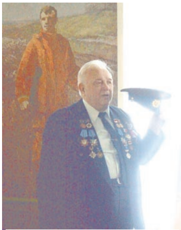
Ценную реликвию Калашников хранит как зеницу ока

Полина БЕНКАЛЮК