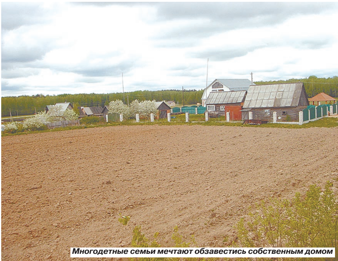
Многодетные семьи мечтают обзавестись собственным домом

Немного больше повезло тем, кто получили землю возле села Хоперское. В начале марта администрация Балаховского района объявила победителя аукциона на выполнение работ