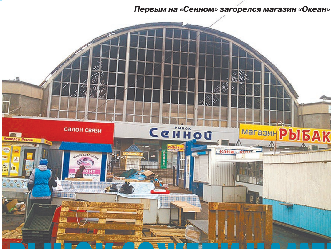
Первым на «Сенном» загорелся магазин «Океан»

Пожар был локализован в 20 часов 10 минут, время ликвидации последствий пожара – 21 час 43 минуты. Общая площадь пожара составила 2000