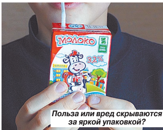
Польза или вред скрываются за яркой упаковкой?

Центр–Саратов». – Этот литр закупленного молока, по-видимому, разбавляется до такой степени, что его можно продавать за 16-17 рублей, да еще и получать солидную прибыль. Мы пустили на рынок школьного молока дилетантов, на мой взгляд, циников, которые сегодня под видом молока продают молочные продукты низкого качества.