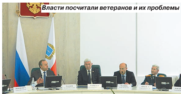
Власти посчитали ветеранов и их проблемы

– 487 человек нуждаются в улучшении лекарственного обеспечения, 2020 человек – в социальном-медицинском обслуживании. Они выра-