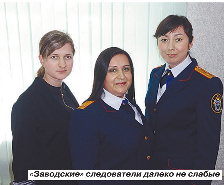
«Заводские» следователи далеко не слабые

когда еще на студенческой практике вместе со следователем выехала на место преступления. Открыли дверь квартиры – а там изуверный труп.