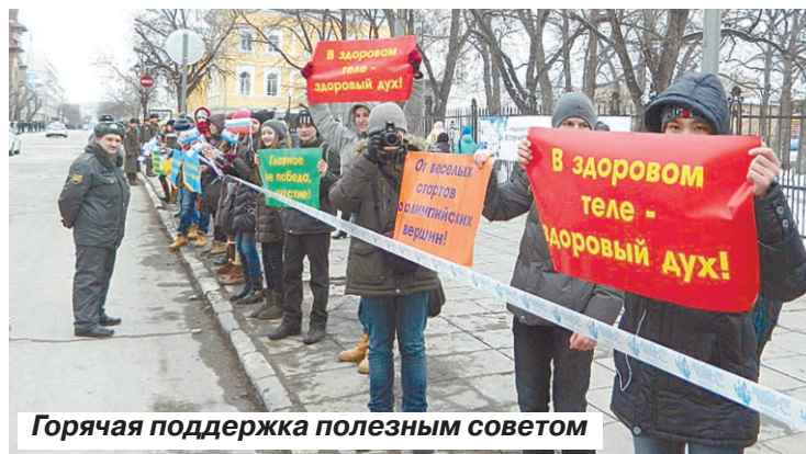
Горячая поддержка полезным советом

Организаторы решили пронести необычное пламя по главным улицам города, чтобы эстафета затронула знаковые исторические и культурные места. От железнодорожного вок-