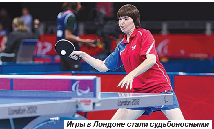
Игры в Лондоне стали судьбоносными

тябре, чемпионат мира в Китае. Поворотным моментом в своей жизни паралимпийка называет успешное выступление в Лондоне.