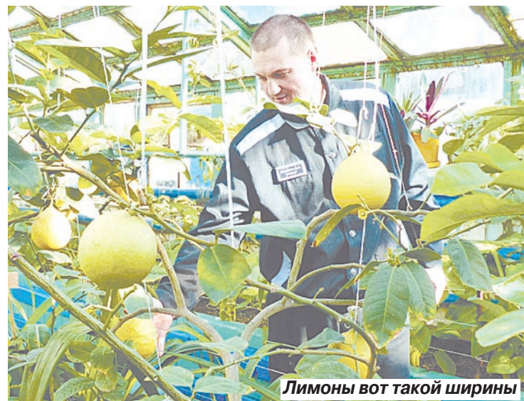
Лимоны вот такой ширины

С наступлением весны всю территорию десятой колонии планируют украсить клумбами и газонами. Они непременно поднимут настроение людям в этом унылом месте.