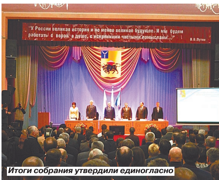
Итоги собрания утвердили единогласно

В то же время головной болью продолжают оставаться работа жилищно-коммунального комплекса, деятельность управляющих компаний, ремонт дорог и дворов. Было время, когда Энгельс отличался хо-