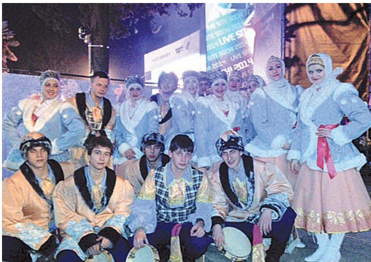
Ансамбль «Варенька» веселил сочинскую публику

день для юных голосистых волжан начинался с легкого завтрака и прогулки к морю. Этот ритуал был обязательным и каждодневным. Как объяснили волонтеры, это нужно, чтобы улучшить дыхание, укрепить голосовые связки, наполнить легкие йодом.