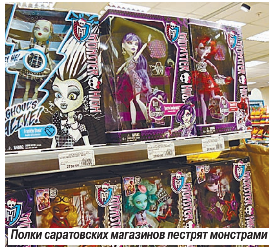
Полки саратовских магазинов пестрят монстрами

Саратовские дети забросили Барби ради новомодных кукол-монстров