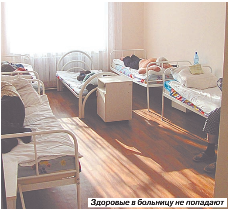
Здоровые в больницу не попадают

дицинскими организациями ТФОМС нашел не только левые счета, но и самих пациентов, которые при этом даже не посещали больницы и не были на приеме у врачей. Так, в центре здоровья городской поликлиники №7 Саратова только за 30 августа 2013 года из 57 представленных на оплату случаев оказания медицинской помощи 41 случай не был подтвержден пациентами; за 10 сентября 2013 года из 16 случаев не подтверждены пациентами 11 посещений. Всего в 2013 году выявлен 39741 случай представления на оплату медицинской помощи, не подтвержденной медицинской документацией.