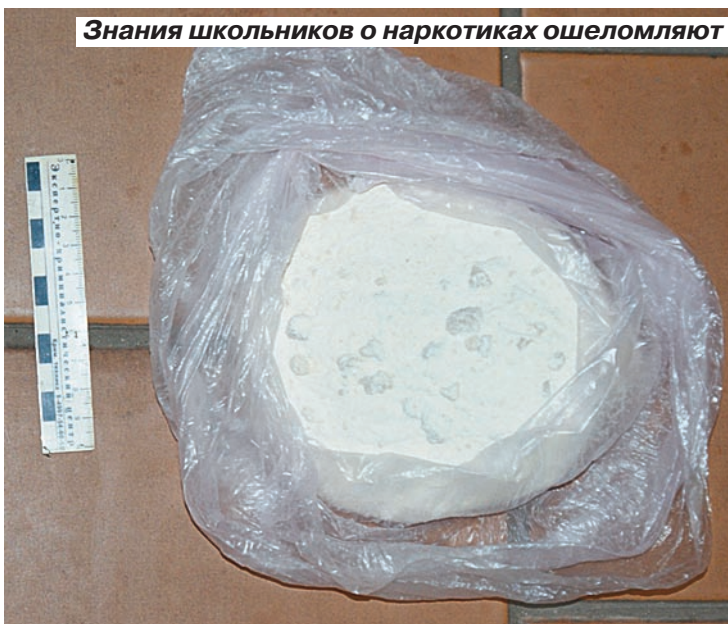
Знания школьников о наркотиках ошеломляют

— Но больные боятся лечиться у нас и уходят к частным врачам. Они боятся попасть к нам в спис-